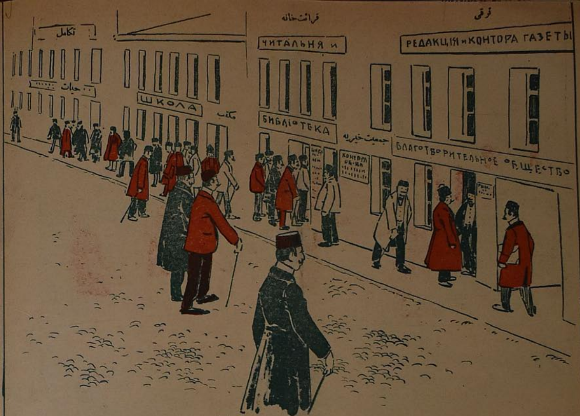
تاشقازده، ۱۹۰۵ - مجى ایلدهكى ترقى прогрессъ у муосльманъ 1905 г.