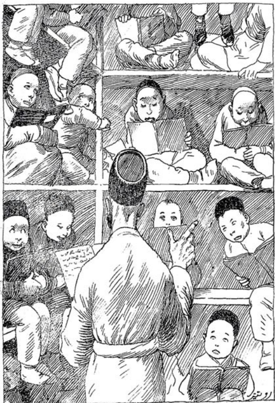
سلمان مسجد مکته Uicora.

کیم بوزولی جوق قایسر! Kimo g arlo bwaomi? (Timo?)