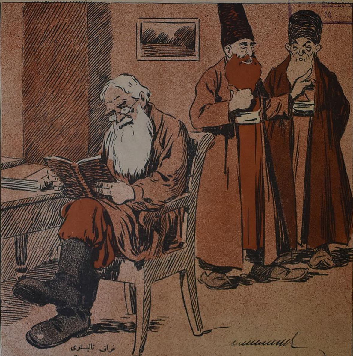
غراق تالیستوی Графъ толстов