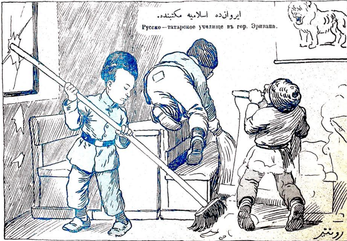
ایروانده اسلامیه مکتبندده. Русско-татарское училище въ гор. Эривани.