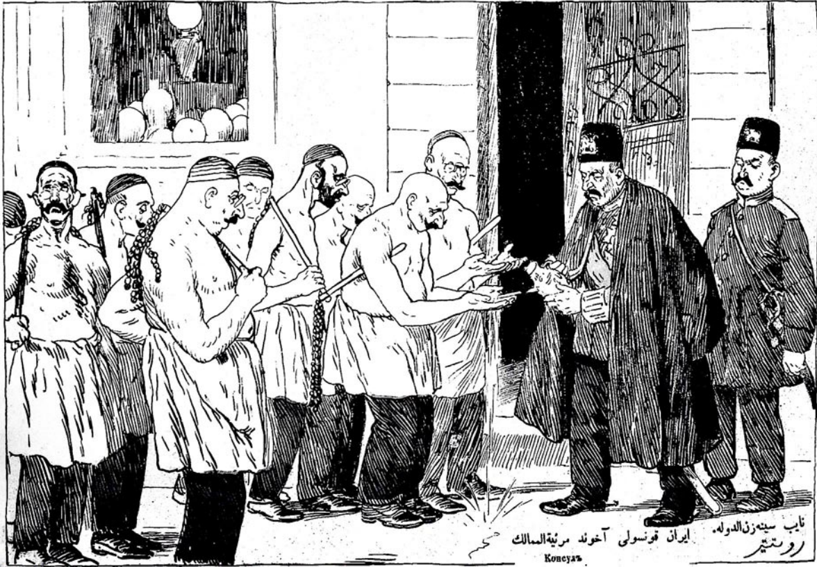
نایب سینہ زن الدولہ ایران قونسولی آخوند مرثیہ الممالک روستیر