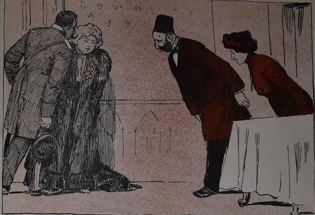
غوڤرناټور خانمی ایله مسلمانلاری زیارت ایډیر Губернаторъ съ визитомъ у мусульманина