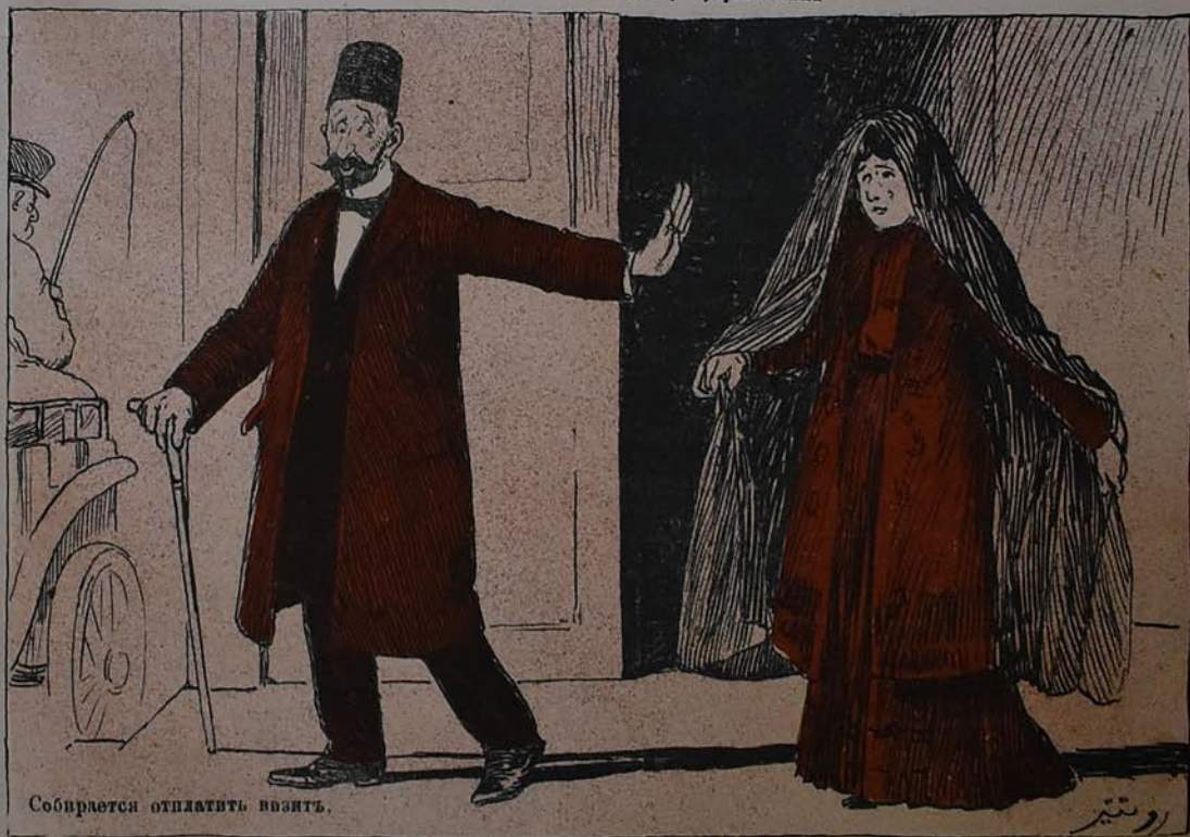
Собирается отплатить визитъ.