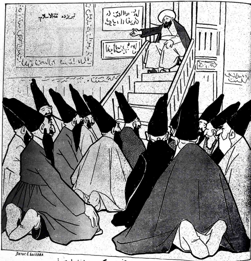
Дитог. С. Быхова

هله من بياييم كه بو ايكي بارماق بوركلي لر فرنگستاندن گوت بزدن نه ايستورنر.