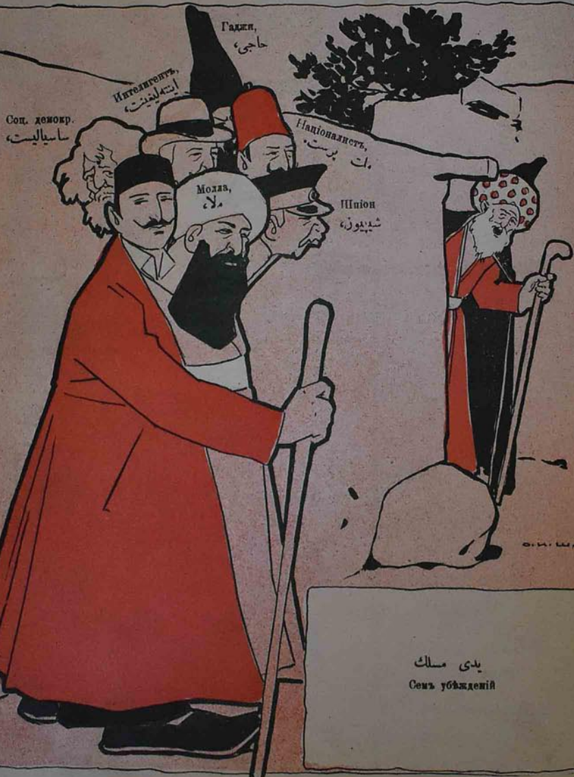
يدى مسك Семъ убежденій