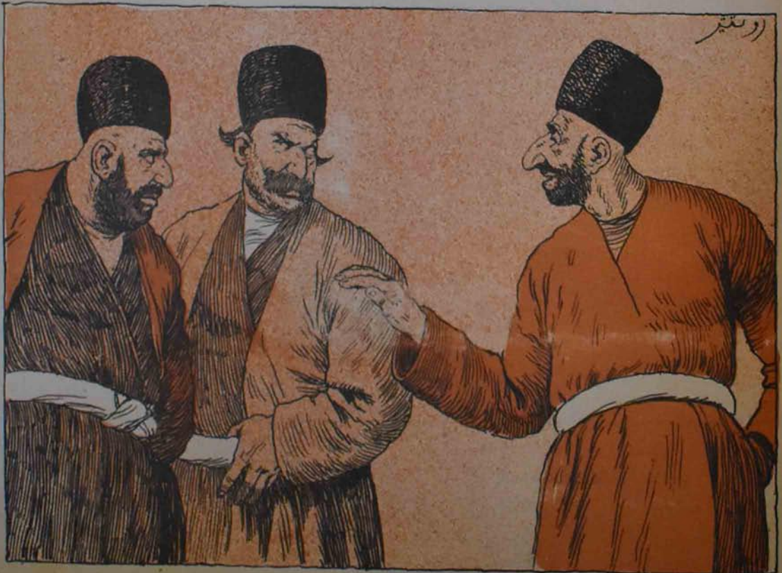
سحبت: قارنجه سلیمان پشمیره دیدی: سن بیوکسن با سنک آتان؟ سلیمان بو بودی:.....(ما بیدی حسین نروده)