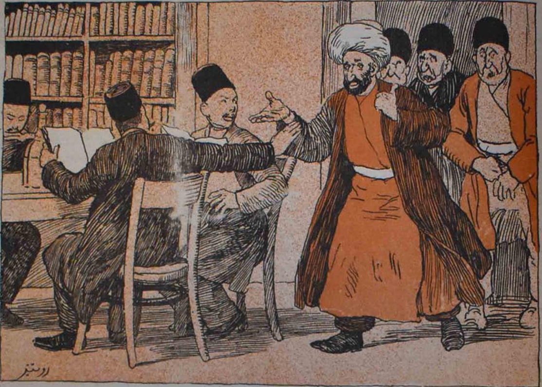
آی فارداش اولولگنی ویر بودا.