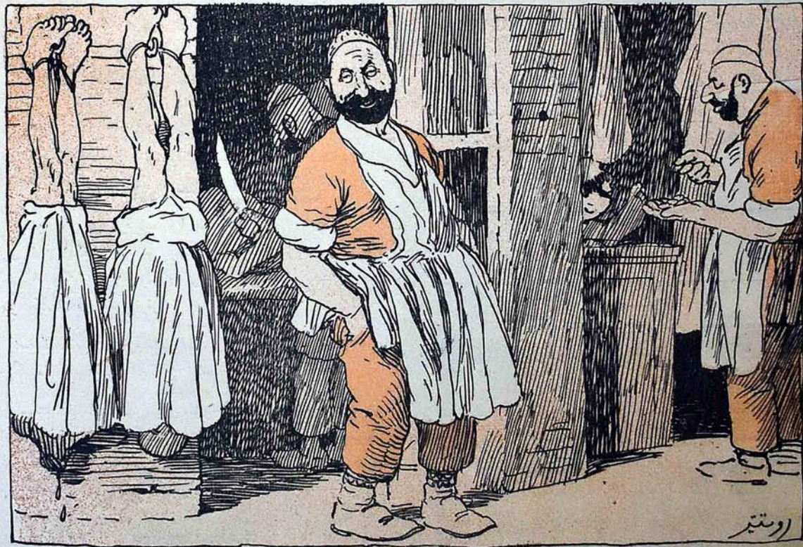
باطوم قصابلاری Батумскіе мясники