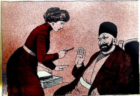
— نادان آلم خانم منیم بر آفریان دیشیمی چک. — سلات اولاده چک دیش بورد که جاننده سکا قرباندی. — سنک دینک سلامتور.