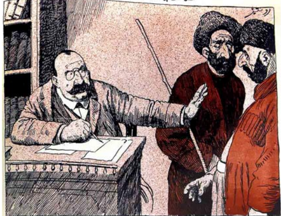
— روسجه دانیشون، روسجه دانیشون، من مسلمانیه ییلدیم تیز سوزگوری دییرن، جنم اولوق کیدون.