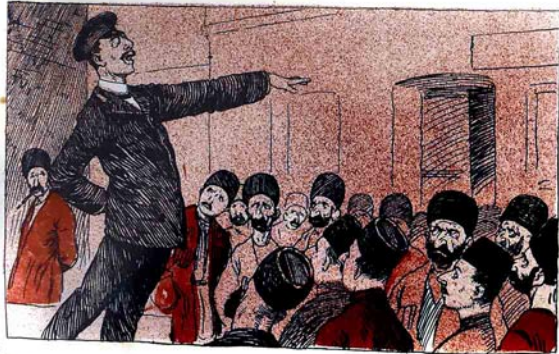
ملك پرست استودیت مسلمان قارداشلارا منیم کچه گرتدوز فکرم بورد که تمسیلی قورتاروب باشیورم ملنه نولوق ایلیرم، بلسکه ییزیم یازیق ملنده گوزنی آچاا.