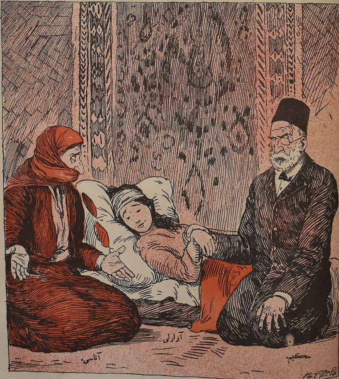
تقریبی بو نیچه مدتده ایله برک ساخلامشدیم که اونک اوزنی قوشده گورمهشدی، آنرده نامرد فلک تقریبی گورستدی.