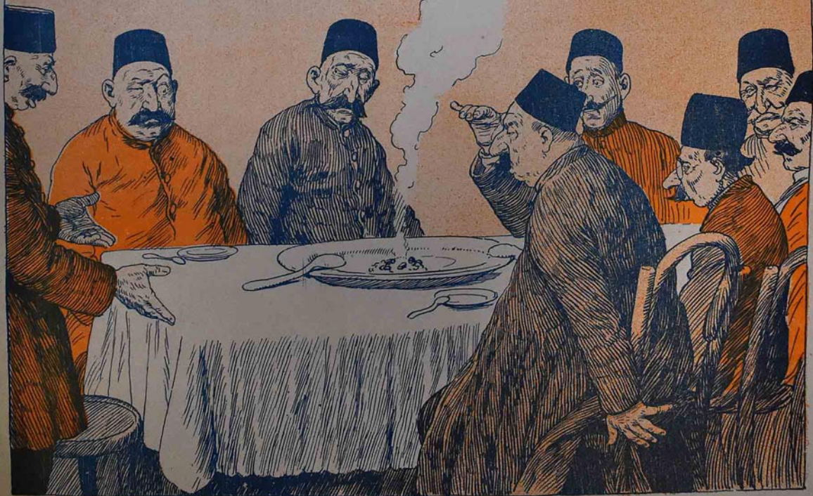
برشهرده بر تونسلخانه عمل جانی . ( تفصیلی همین نمره ده )