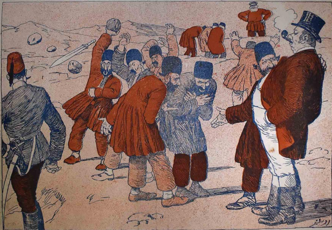
ایران مملکتی و قوناقلاری قبول