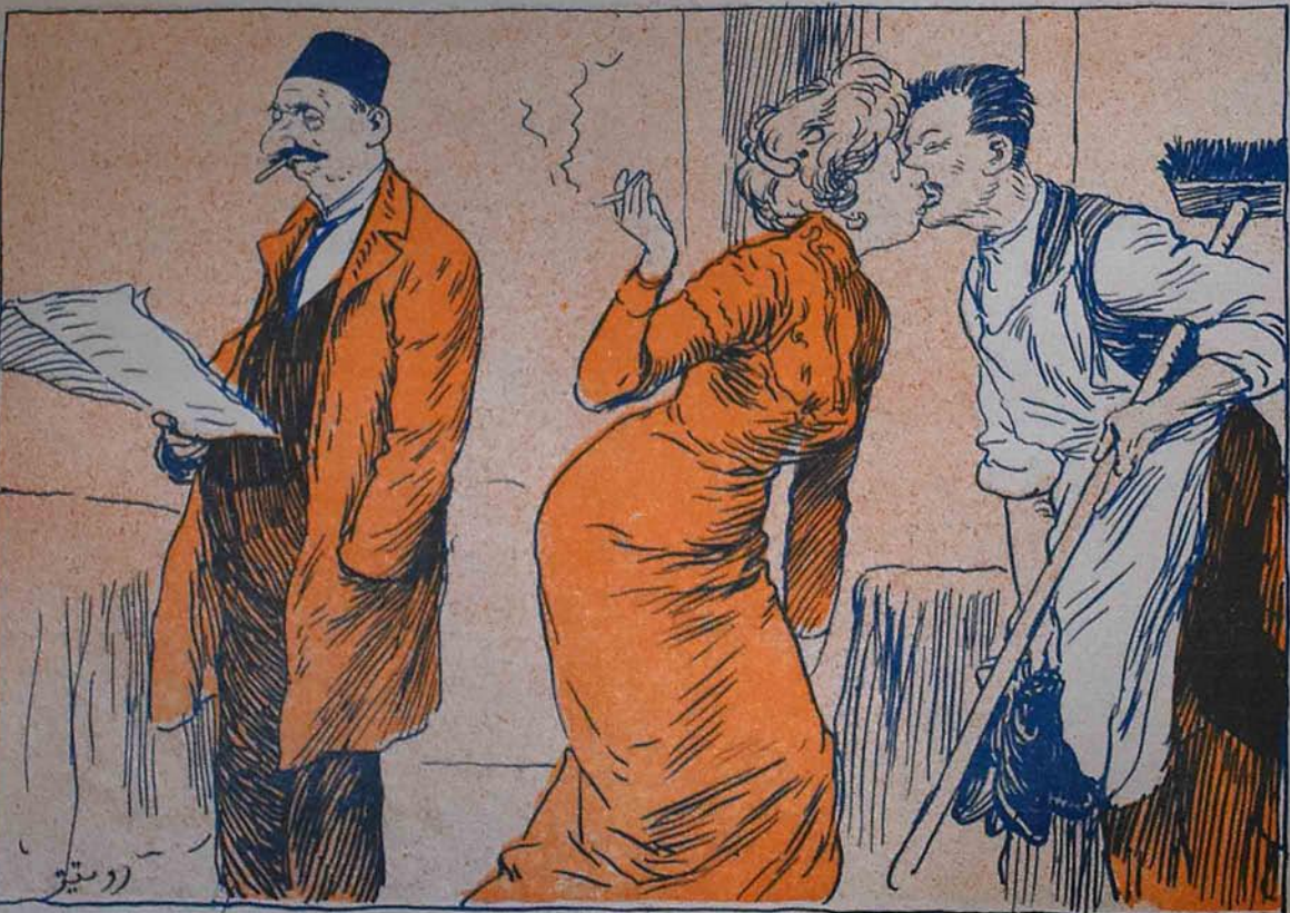
روس خانمی آلاندان صکره قوللوغی بر اولدی.