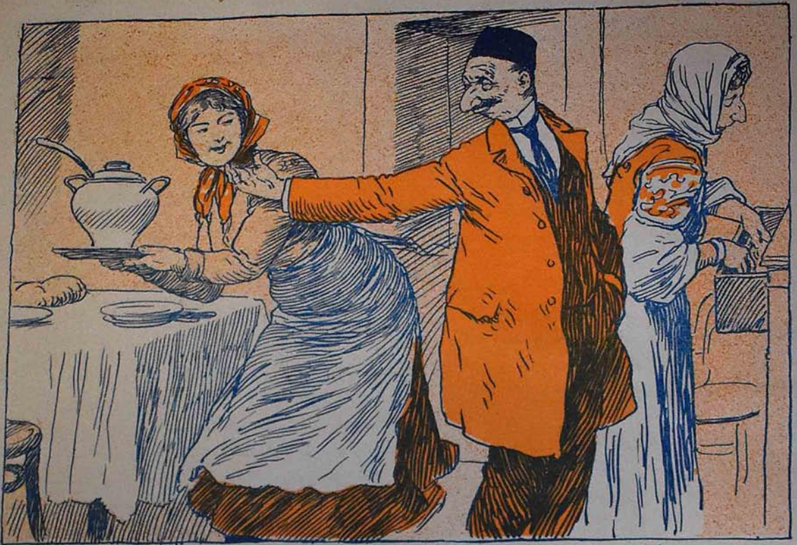
سلطان عسکری اولادنه ایوده قوللوغی برایدی.