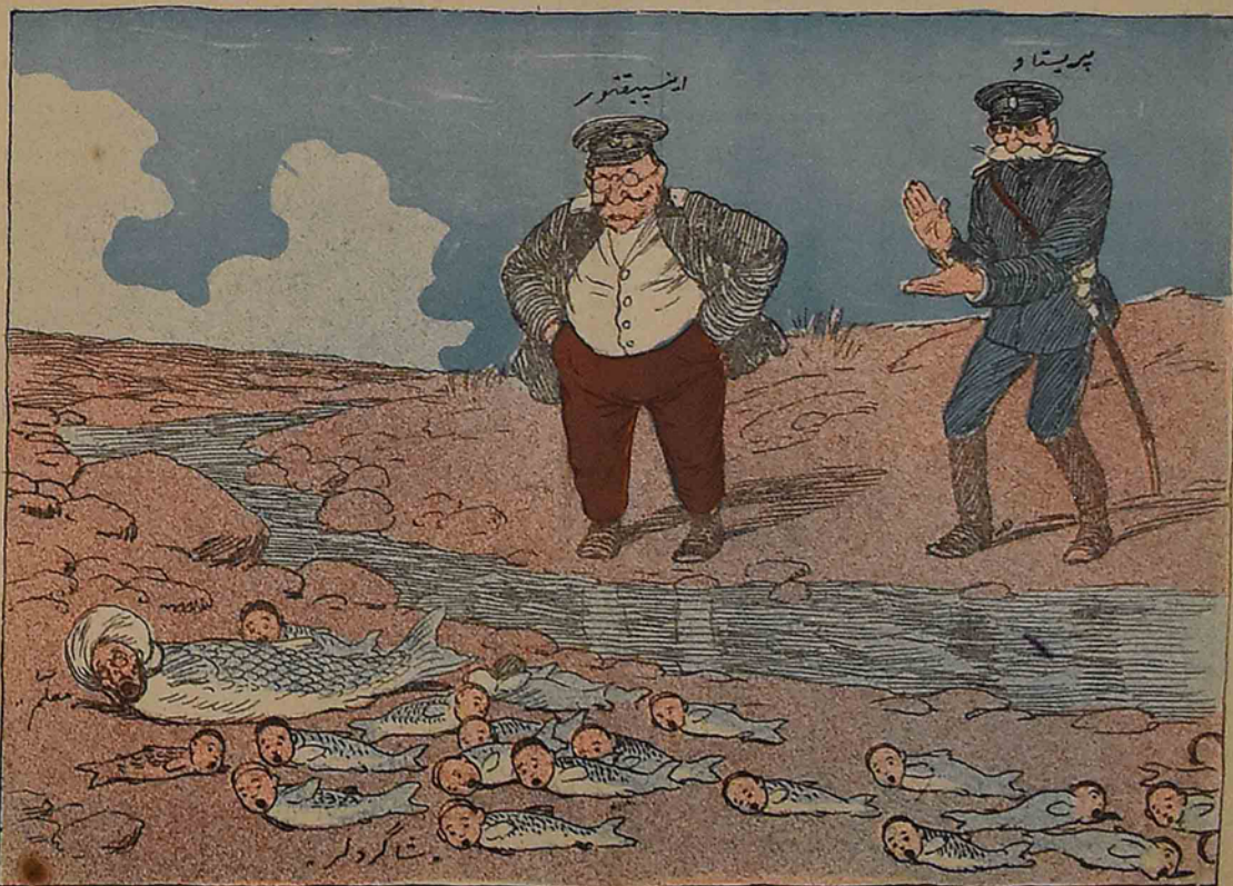
اینسپکتور — ها، باخ! سزک بریکز و حالکز بویله اولمالیدر.