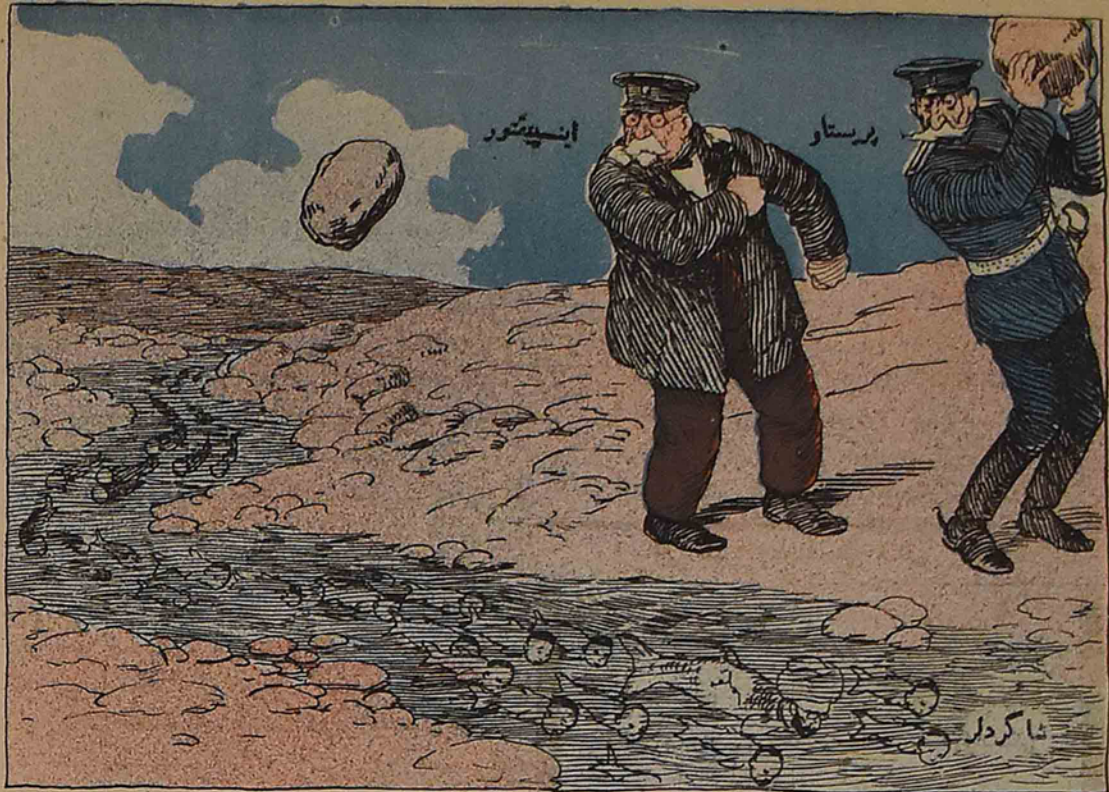
اینسپکتور — اوراسی سیزه یاراماز، چیغک دیشاری، اوتانمازلارا!