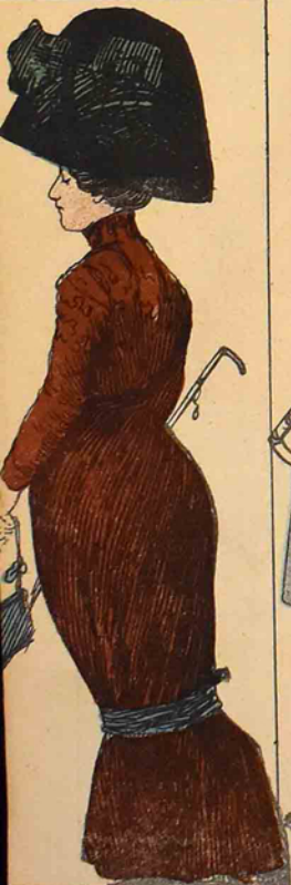
مادام برونه قیافه در؟ چونکه مودادر