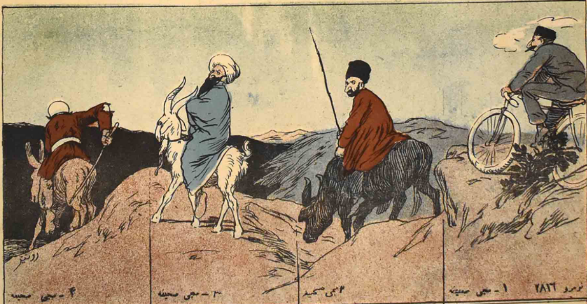
نومرو ۲۸۳۲ ۱ - جی صحیفہ