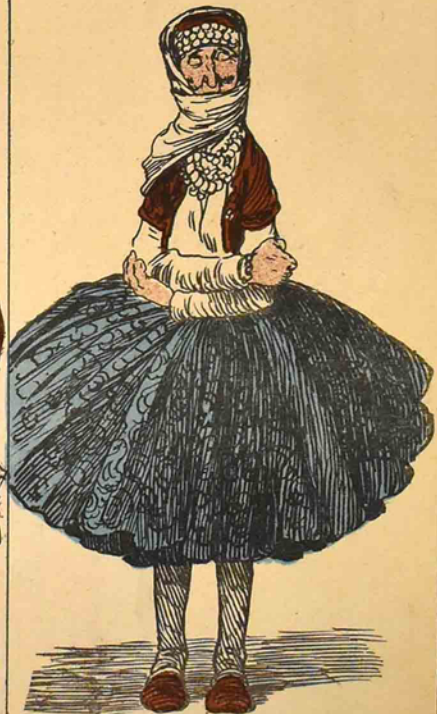
خانم ، حماسه که گیدیرسن بو قدر پان روتزین شیه کر کردم؟ - آخی . نه قاسمرو عا دستدر