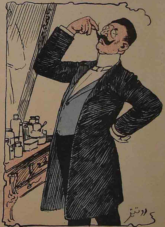
یورو پالیلاری تقلید ایدن مسلمان