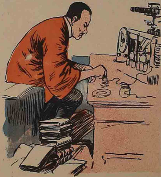
یورو پالیلاری تقلید ایدن یا پونیا می .