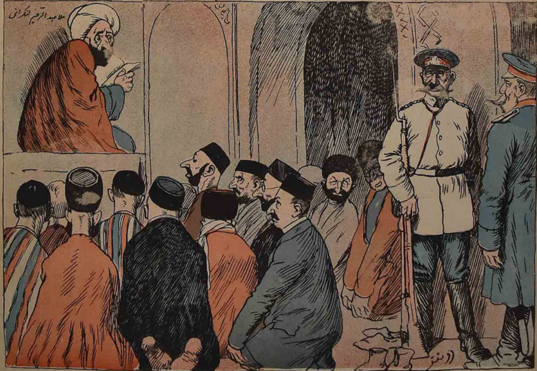
ہونڈان سورا ملا لار وعظ ایدین وقت تارا دادویلا رده گرگن مسجد ده اولاک ملائک میرید لری عارنندی دو گسوتن . ( حاجی طرخانده )