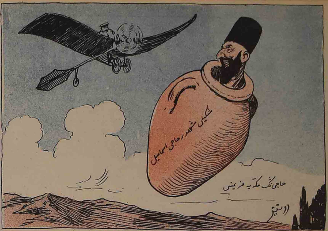
حاجی - آخاخ کا دور ، شکامی جاتا جاقمن ؟.....