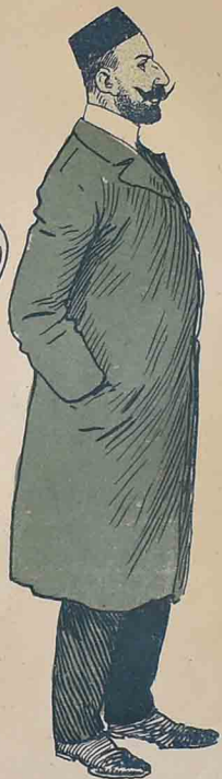
۱۹۰۸ ده بوناسونده دوشدی