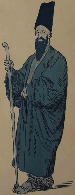
۱۹۰۰ هجی ایلده گنودن تاجوب گلنده