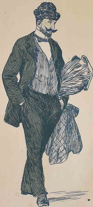
۱۹۱۰ ده بمقامه چاندی