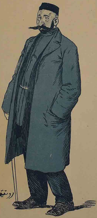
۱۹۰۵ ده بیله اولدی