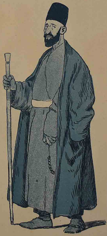
۱۹۰۳ ده برقیان فیه دوشدی