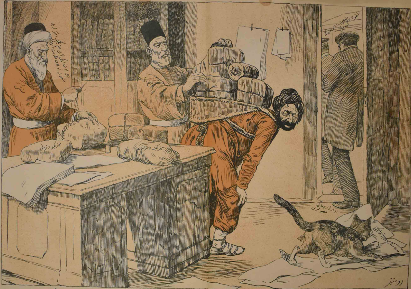
کیم اثبات ایست که بر اداره روحانیه ترک بزه ایگی چیک مک خیری وارد - اوگا بزرگ دزدان لای بیش ایل پول سز گونده ره ریک.

© 1910 Издательство И.И. Република И.И. Караджали