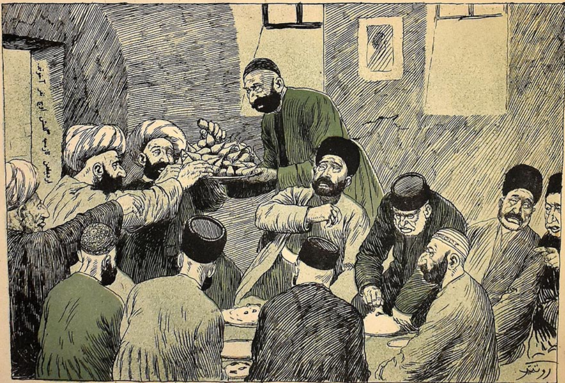
ربیع الاول آیتک ۸ خده با کرده سوراخانکی کوچده بر حامی لک پادارنده خلوتجه ترتیب اولونش عمر طوی.