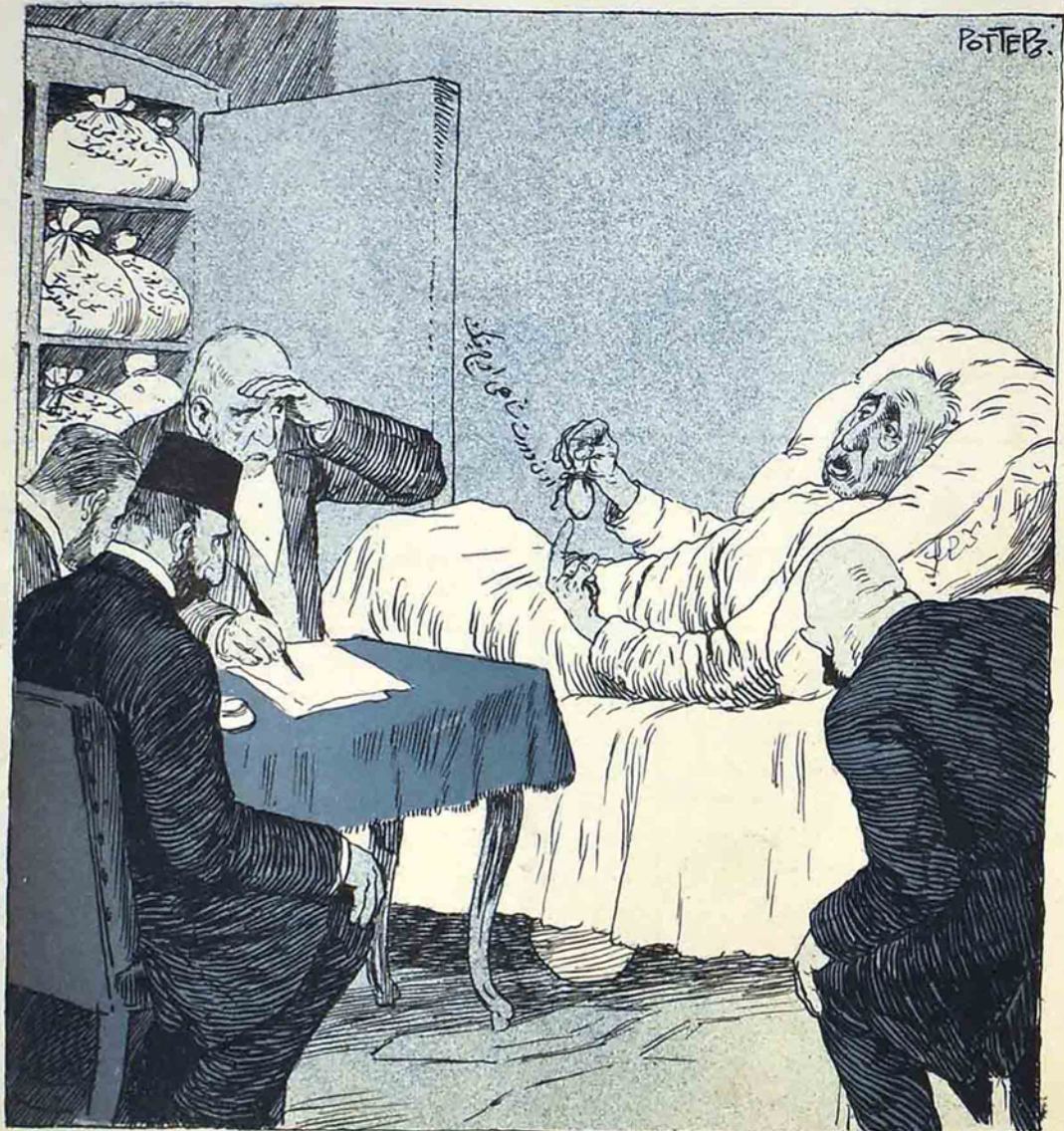
— بو اون دورت شاهی اوچ قپک مبلقده وصیت ایدیرم ملتہ بو شرطیلہ کہ اولادیمہ قویدوغم دولت اولاره آز اولسه، بو اون دورت شاهی اوچ فیکدزده اولادیمہ بر شی ویرلسون.