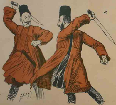
ایسکی درغما قارداش ایولندن سورا

آی کوسه باغیاڭ تزی! اوز سوپورگن آندیرای تالاب که نم سوپورگم ایلا سوپوروسن! آی میدگی گوروم! - سنگله میدگی گوروم آتایگله. بیلا سوپوره چکم! . . .