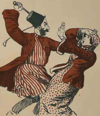
- سکرینگ تزی، منی ده آتامی ده سوگورسن ها!

- قارداش، اشتاقه سینه پر باغیندا ایولدیرمچکم که سورا دلعا راحت یاشیاق.