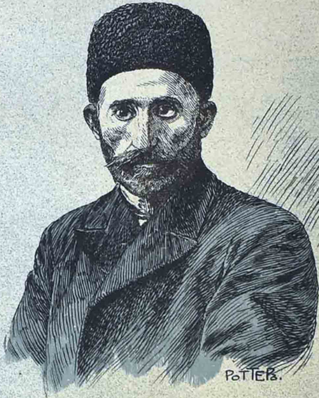
پد ابرول آئنگ ۱۳ سنده ونات ایدن شاعر میر . صابر »