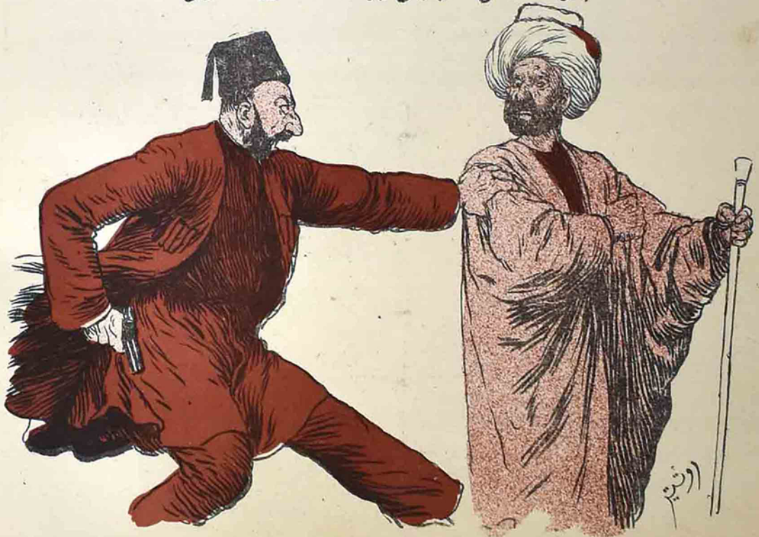
باطومدە مۇسۇلمانلارنىڭ «ئاغلىق» اوستە دىۋالىرى