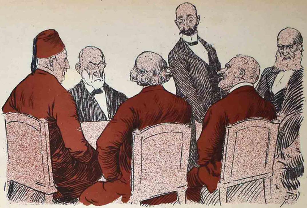
باطومدا غلانى سەچكىسى بارەسندە، غلانىلارنىڭ مشورتى