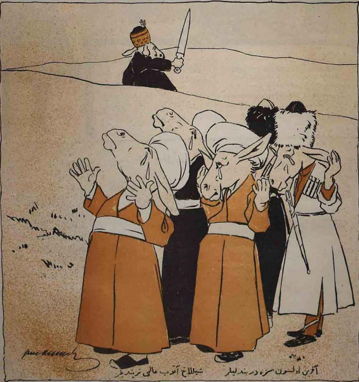
آفرين اولسون سزه دربنده ليلر شيللاخ آدوب عالمي تريندئر