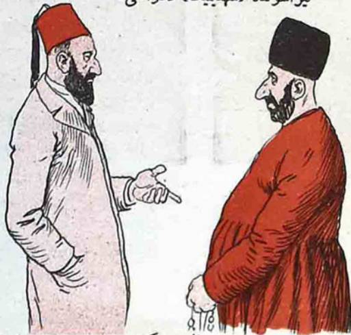
باطومده حاجی دلالاتی و حاجیلرک روسکی اوبشیتوایه ساتیلماسی،