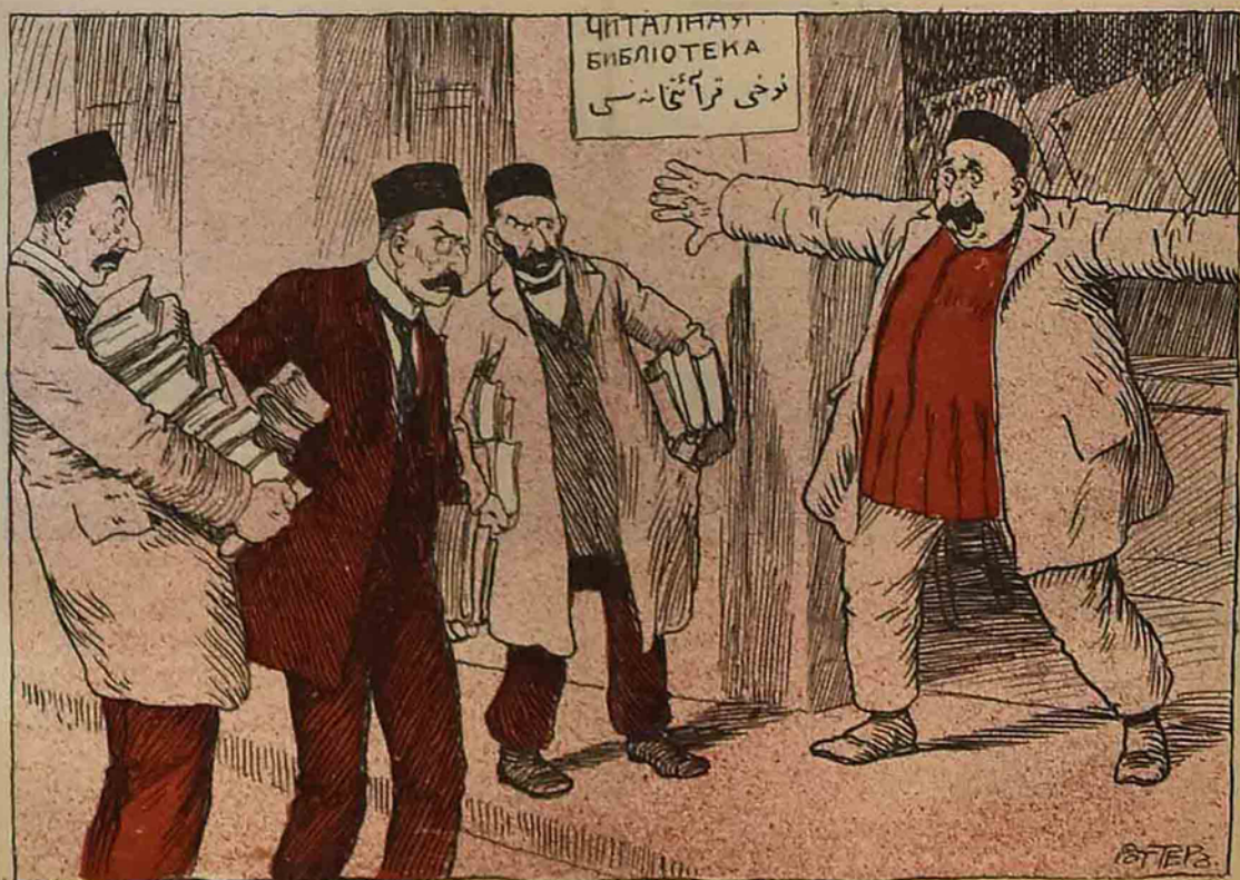
قراڭخانىھ ناظرى - بوخ، بوخ، بورا قراڭخانىھ دىر بىرچە غازىت اوخوماق، من كىتاب قويماق راضى اولاي يىلىمىم، آبارا كىتابلار اوزگۇرگۇ اولسون