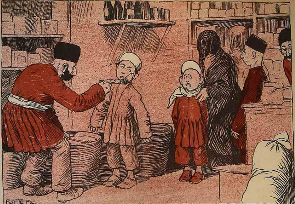
بوياخچى ھانسى اوشاغىڭ بوغازىنى بىر آز گۆي سورىنى، ھمان سائت اوگورمگى رىغ اولار.