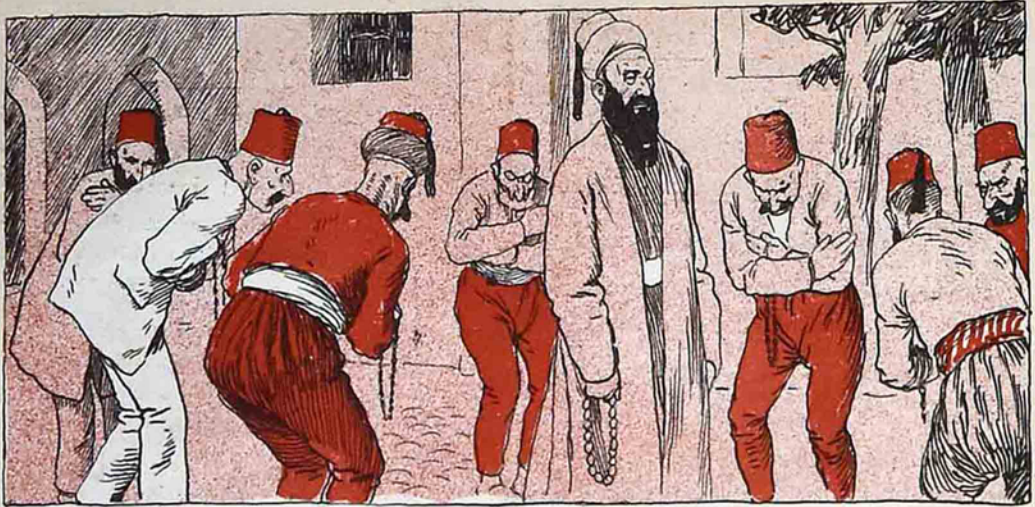
کیراسونده «مهیدیلیک» دعواسی.