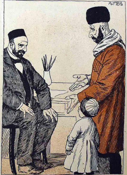
(ترجمه حالی همین نومه)

من اول شرم کر بلا دشتده بیداد ایتشم! ظلله بیداد ایدوب عالمده بیر آد ایتشم!