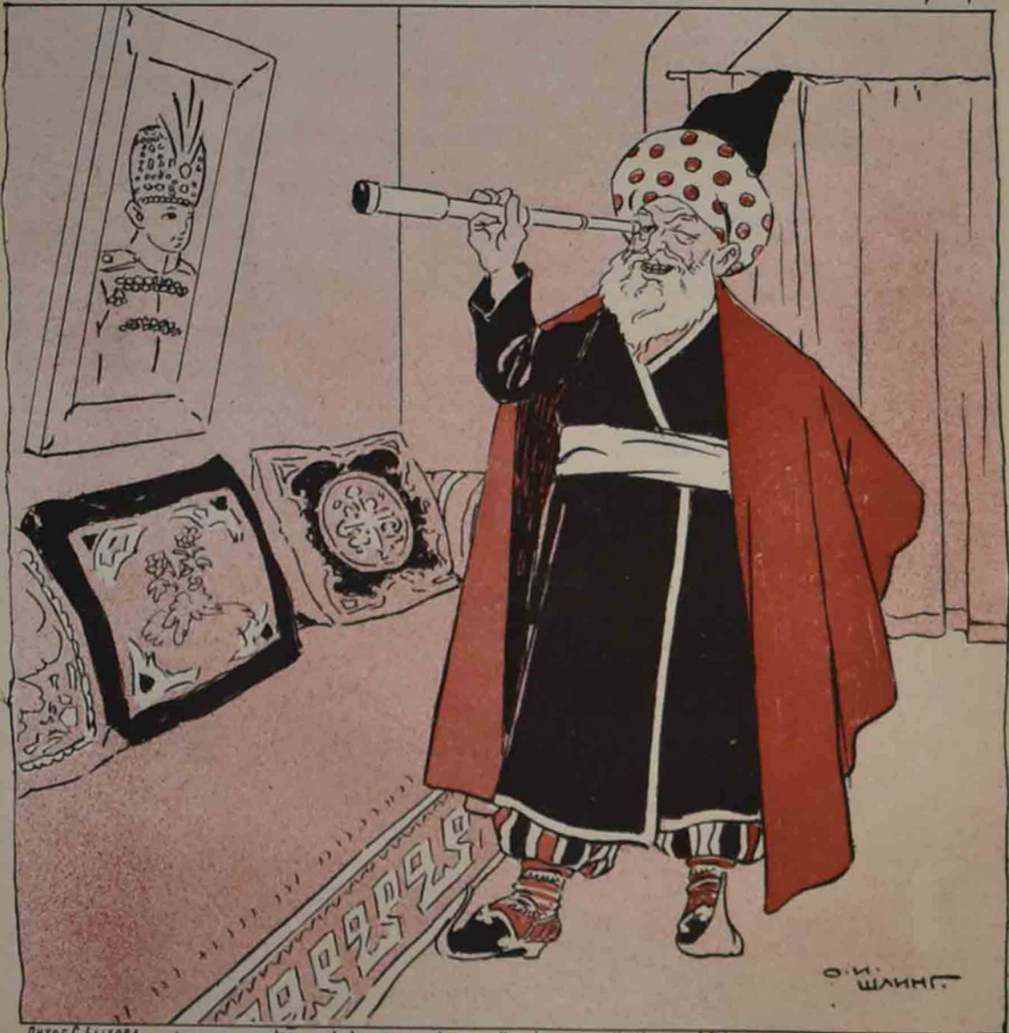
Лятог С. Быхова تربيه تايديني ير تبريز، بابالاري مظفرالدين و ناصرالدين شاهه نعلي قاجار، اتاسي محمد علي، به به به، بار خدايا! سن اوزك حفظ ايله، شاهلار آراسنده بو شاهزاده ني! ترجمه حالنده بير نيجه معلومات:

№ 33. Цѣна 12 к. МОЛЛА НАСРЕДИНЪ ۳۳ قیسی ۱۲ قیك