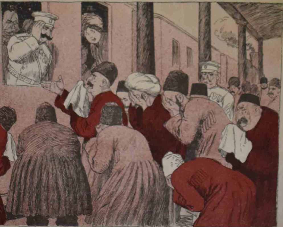
قوللوقدان چىتوب كىدىن تاجاننىك