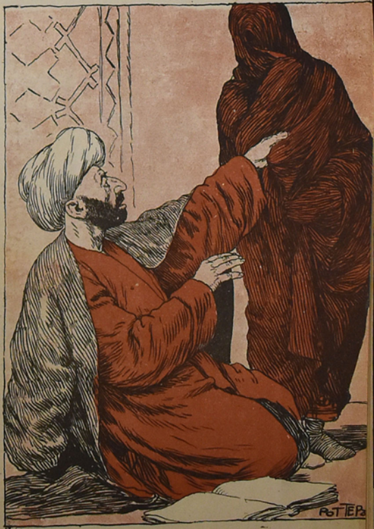
اوتانما، اوتانماہ گناہ دکا، نظر صیفہسی اوخویشام.