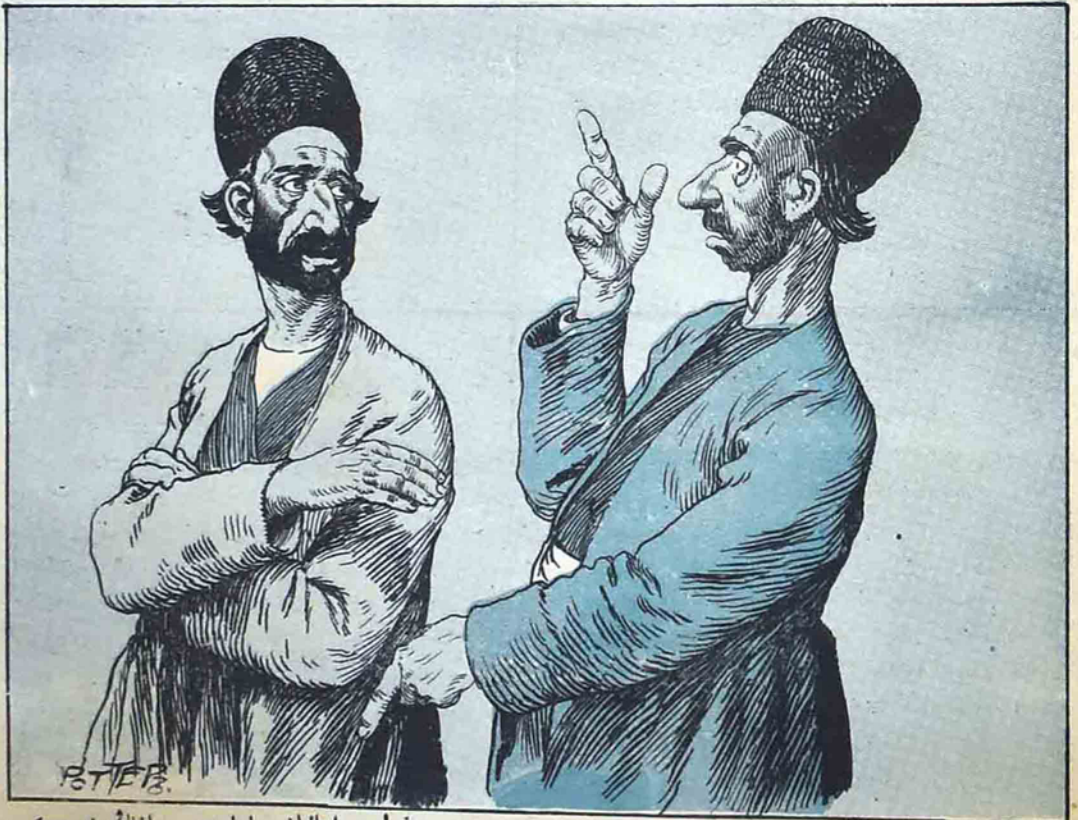
— شهدی محمد جعفر! بر ایتالیان داواستدن عاغلك نه ككیر? — بالام، هر چند كه عثمانی دیلاره، اما آدامك گه قانی قاینیور . . .