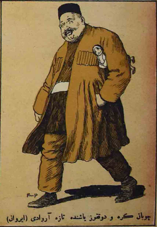
چوبان كره و دوغوز ياشنده تازه آروادي (ايروان)

آند اولسون الله، تياترده اوينيان اوزي آچيق مسلمان آروادي ايله گزن ايروانلى لار اليه دوشه لر، قانلاريني دوشاب كيبي ايهرم! O, дайте имъ выпить кровьъ приверженцавъ женской свободы..... (Эривань)