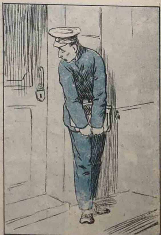
درس دن قووولش مسان اوشاغی