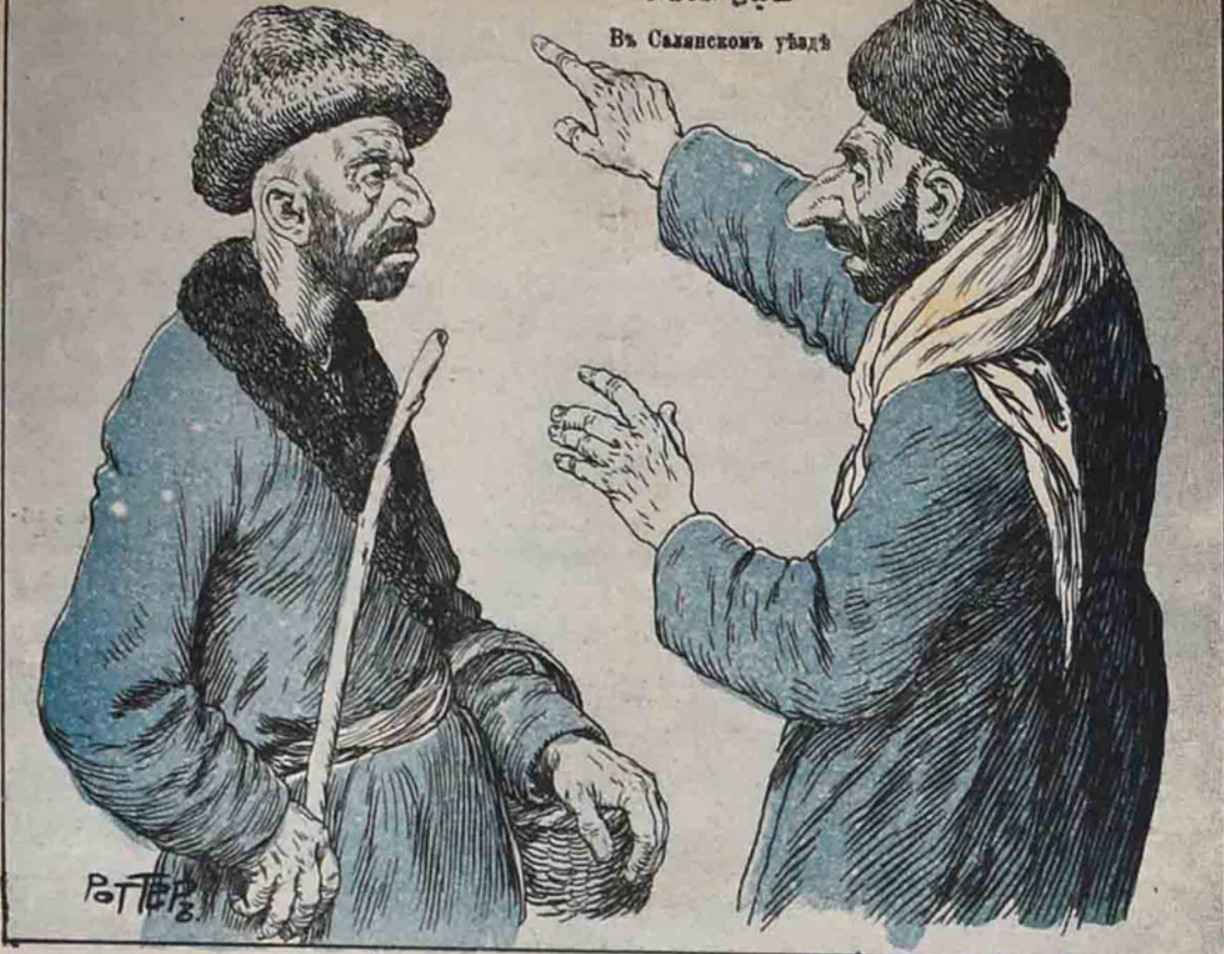
Какъ же ему не брать вѣтку, когда у него двѣ жены.

آکیش، قاضی مزی مذمت ایلیورل کے رشوت آلیر: بہ بی چارہ ایکی ایرینی نہ ایله دولاندرسون؟