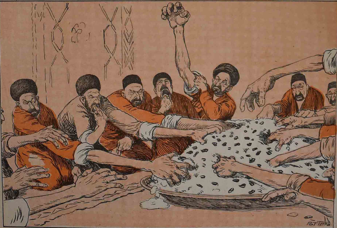
مشهدده قاقازلی لار انجنى، یعنی اتحاد بلاو اسلامیه.