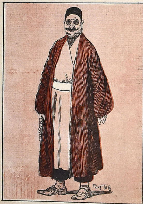
محرم لك قباغی

— او نه دی ایله کیزلین آباررسان؟ — مسلمان غازیته سی در: دونن قاسم بك مسجدنده دانیشان آخوند مزدان کیزله دیریم.