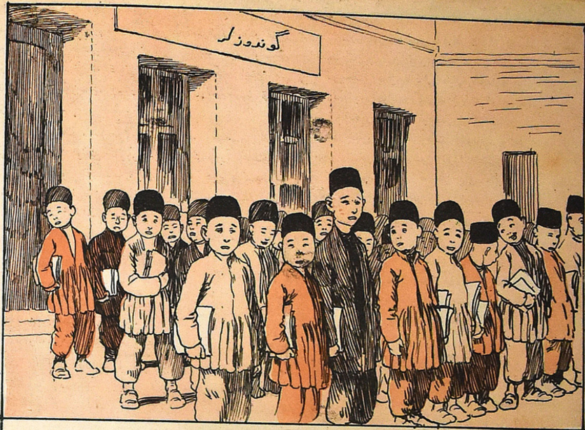
واقایده (نوروز) مدرسه سی