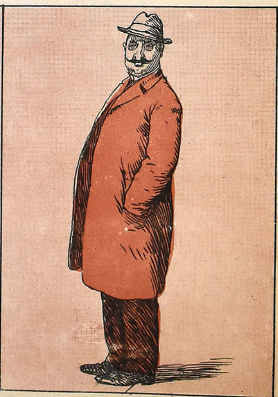
اینته لگیت مسلمان سایر وقتده