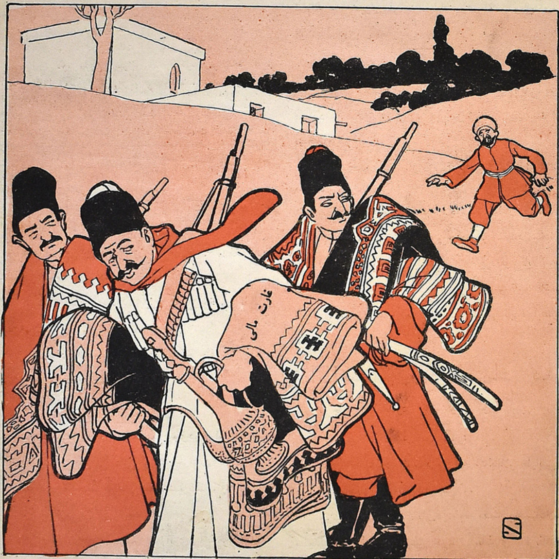
ایراندہ قافاز دیموقراتلاری "Социалъ-демократы" (Персія)