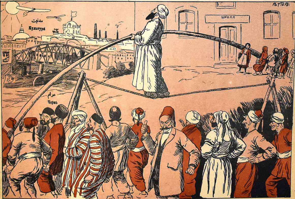
(Аңаңык бир аужи тзларык бир аужи ерамк тбағы ксуб)