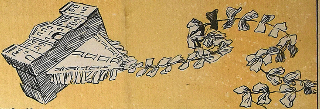
Воздушный змей, пущенный на юбилей Оренбургского ауфгау Султанова.