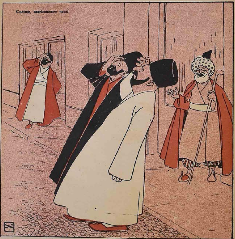
Солнце, заходящее часы

№ 2. Цѣна 12 к. МОЛЛА НАСРЕДИНЪ ۱۲ قېتى ۲