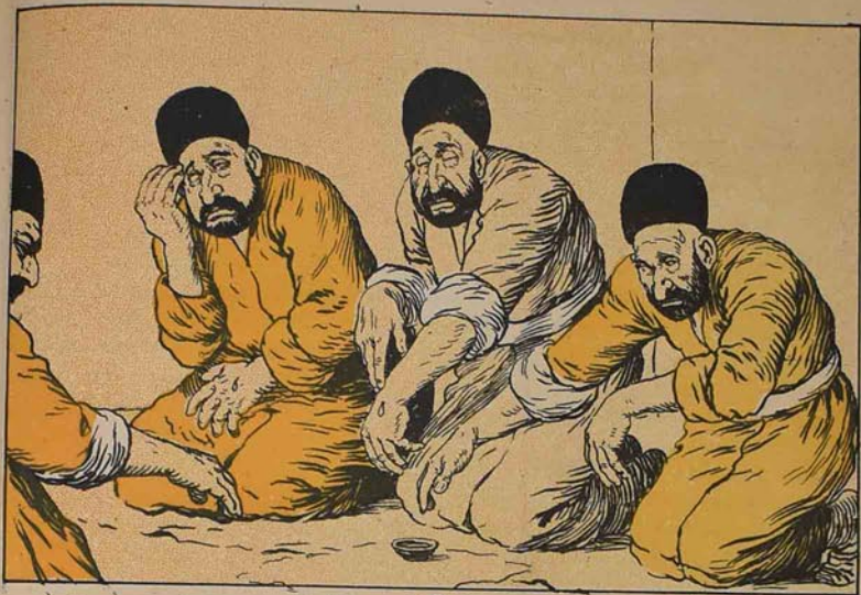
دستار آلوده بو يکه لکده