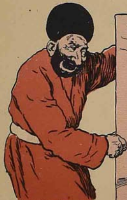
И тогда я радовался