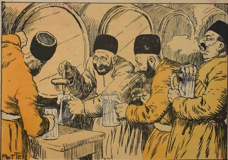
چاخر ايجنده بو يکه لکده