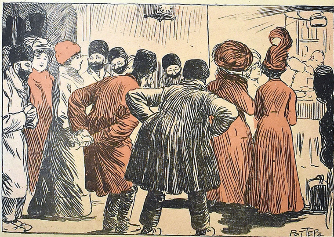
Поѣздъ прибылъ ماشين كلى