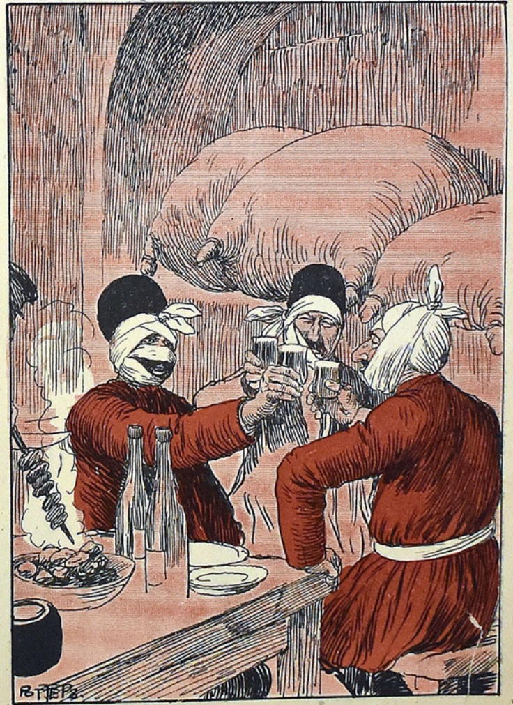
(عاشورانک صباچسی کونی)

دورت و خرج فویوب دورت یوز کتاب چاپه ویریمش، کتاب ساتیشام - За четыре года четыре книги