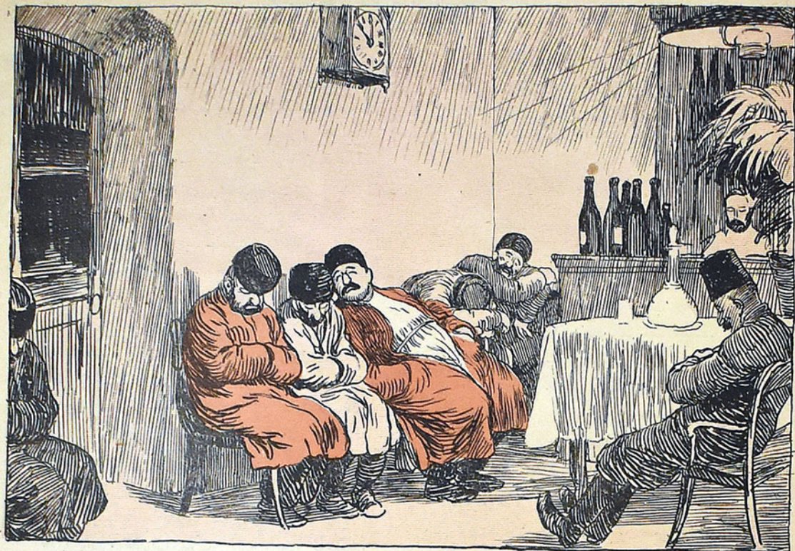
بولاخ و اغزالنده ماشينك كلمگنى كوزاوريك Въ ожиданіи прибытія поѣзда