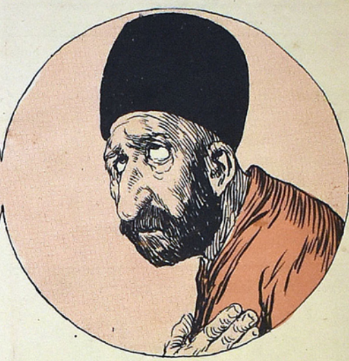
واقعا، گوزل مرنيه حواندر، قباچه جماعتی چوخ گولدولوردی.