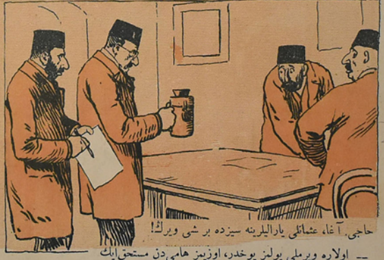
— اولاره ویرملی بولمز یوخدر، اوزیم هامی دن مستحق ایبک