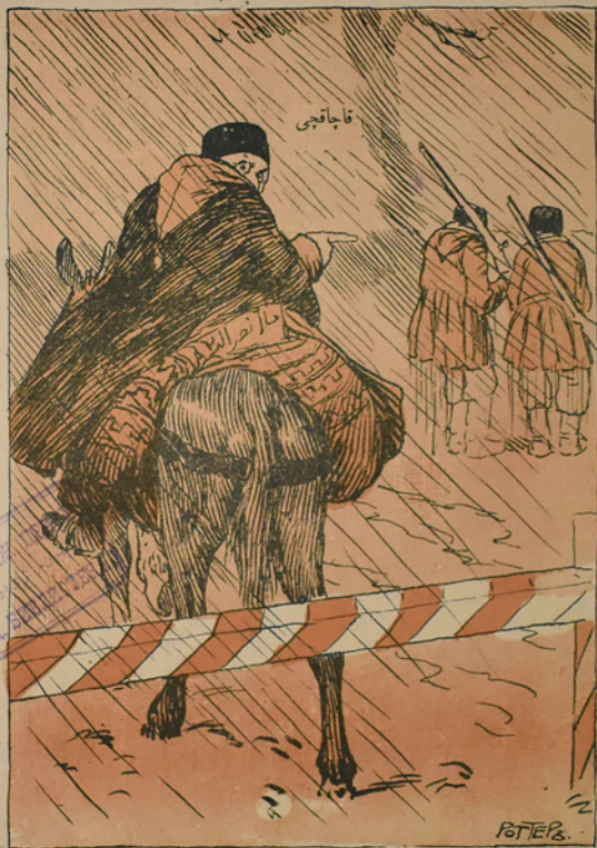
برجه سلامت بو آرازی کیچسیدیم و بو یو کمی تبریزه بتورسیدیم نولمز دیم