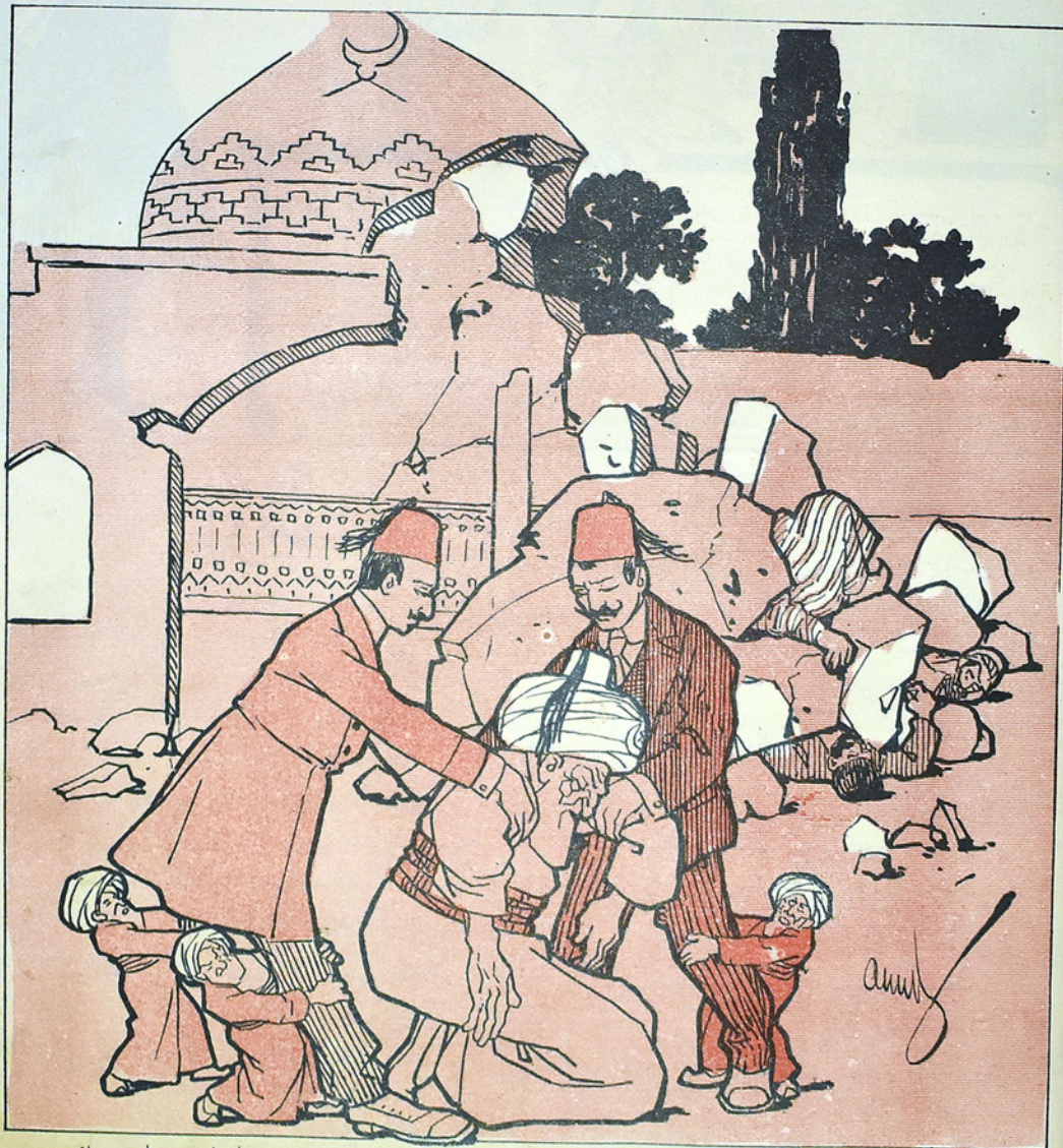
چوخ محکم بنا ایش بو مسجدک بناسی حیف باخان اولمیوب یله اوچوب داغیلوب و بو بیچاره لری ده باسوب ازوبدر.

ایستک حارا آبادیاجولان آید قوتیادیم سکیم آتدیلان