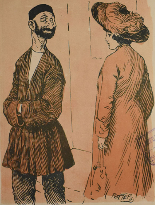
بوی .. قورخودام .. بو کیشی منی گورجک دورت گیز اولدی.