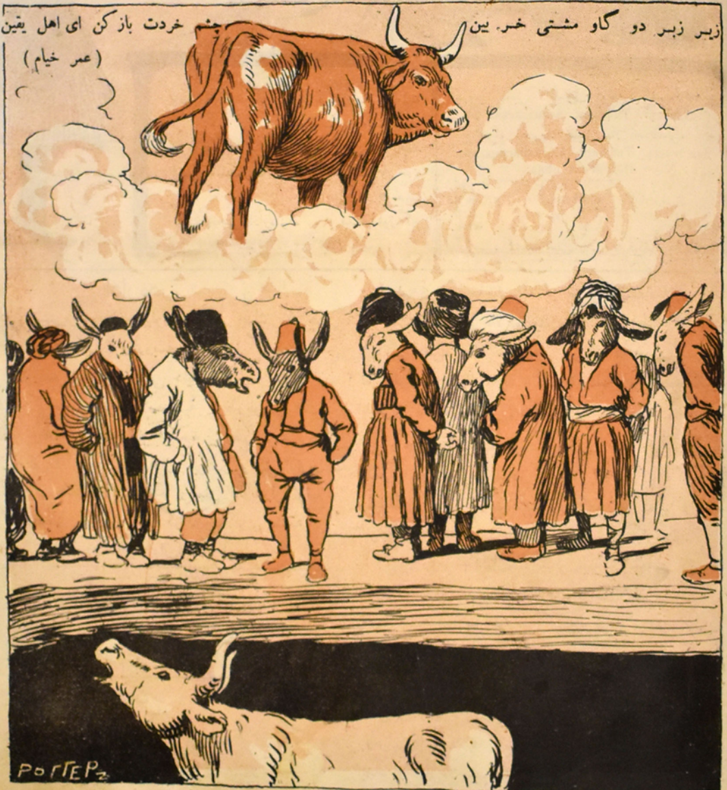
چشم خردت باز کن ای اهل یقین (عمر خیام)

کاویست در آسمان نامش پروین يك گاو دیگر نهفته در زیر زمین