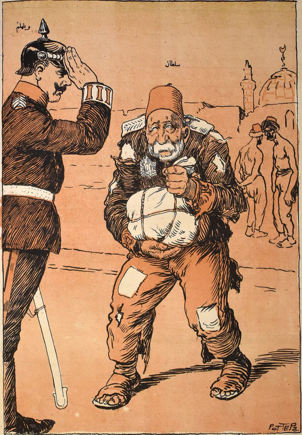
ملتیم و اوزوم آج اولاً اولاً، جمیع گمانم بوالمدہ کنہ کلیر، اونیدہ سن «حامی اسلامہ» (برک سین) تقدیم ایدیرم.