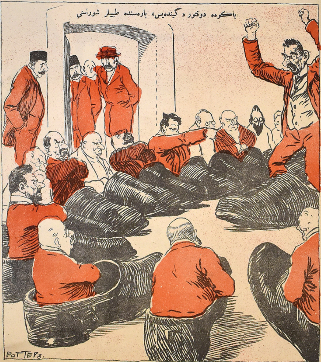
باکوهه دوكتور «گيندهيس» باره سنده طبييل شوراسي