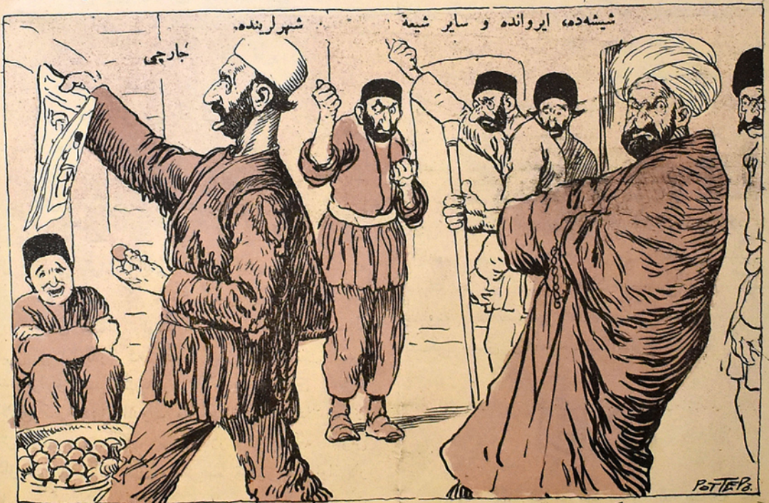
ی اللهی سوون! هر کس ملا نصرالدینی اوخویا کافر، مرتد، ولدانزادر، اوشخص ایله رطوبت ایله ملاقات ایتک اولمان