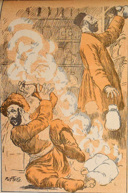
جميع دردلك درماني بو توربالارك ايجينده در.