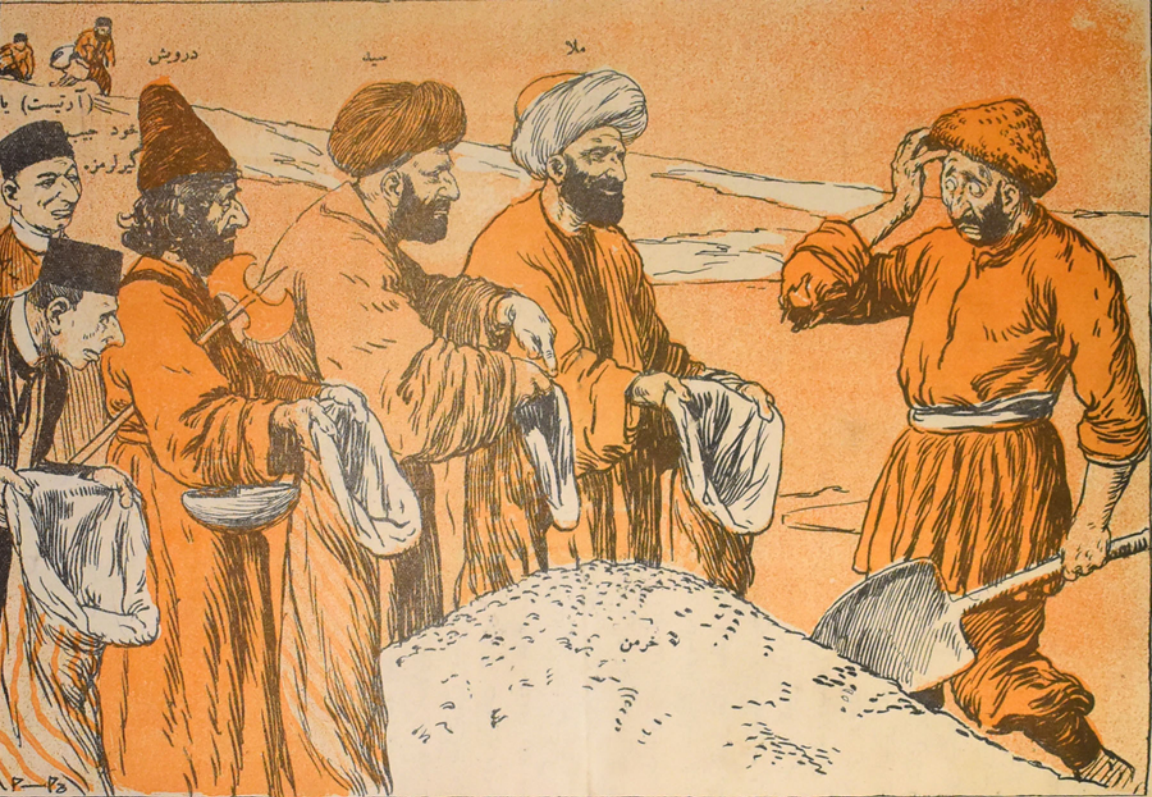
اکیچی — بار پرورد گارا! بو ملا، سید و درویشل همیشه کیلیدی، بس بو آدواده اوخشارینی قرخلار کیدرلر؟