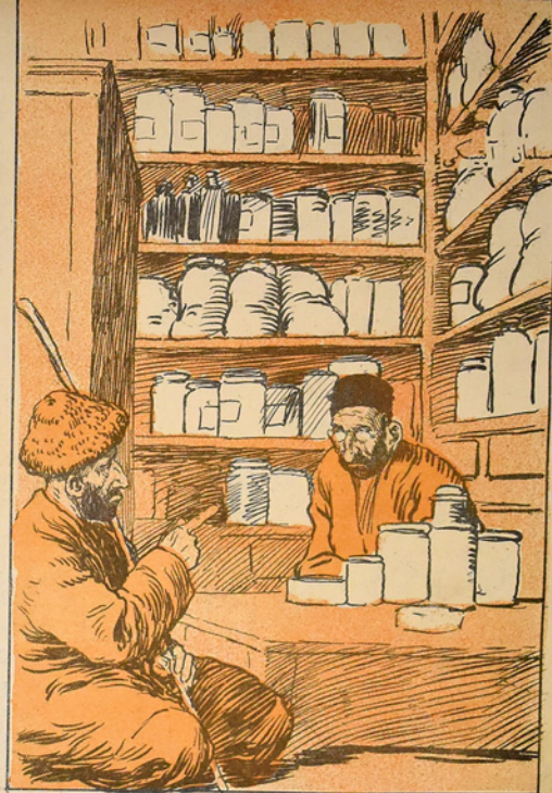
عمى، عايب اولماسين سيزدن بريم جعفرك آناسينك قارنى آغريوره، بر دوا ويره يلرسنى قورتارسون. فادالك آليم، باش اوسته بو ساعت يله درمان ويريم كه بر دقيقهده ناخوشكى دينچلتسون.