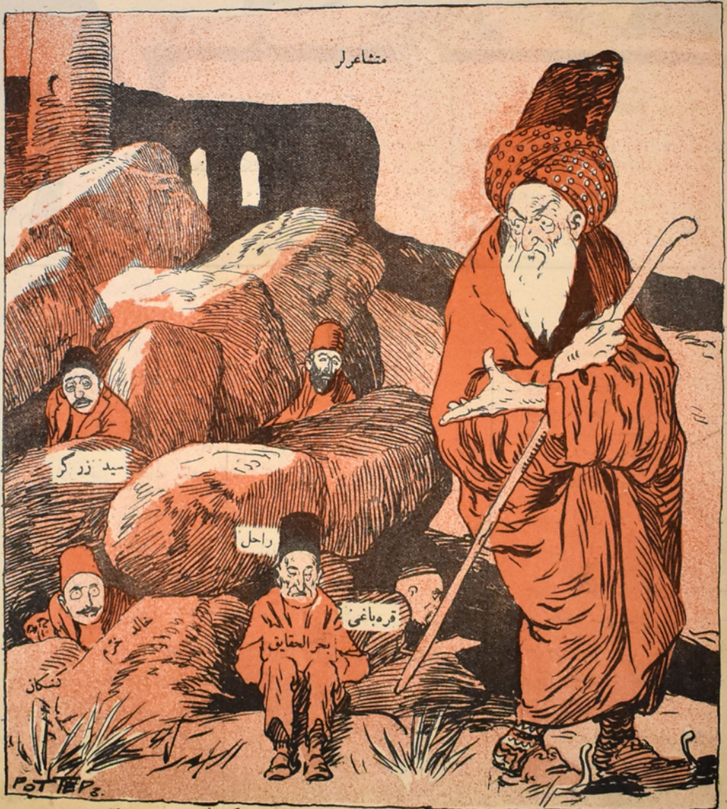
یوخ ایله د کل شاعرک آنجق آدی قالدی