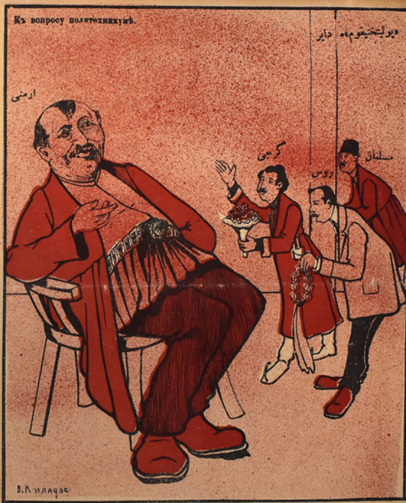
خوزهین، الله خاطرته یا خجیرت اول یا مسلمان مفتده یا جسمه گونی یا بازار گونی منی آزاد ایله که دینیجی آلم...