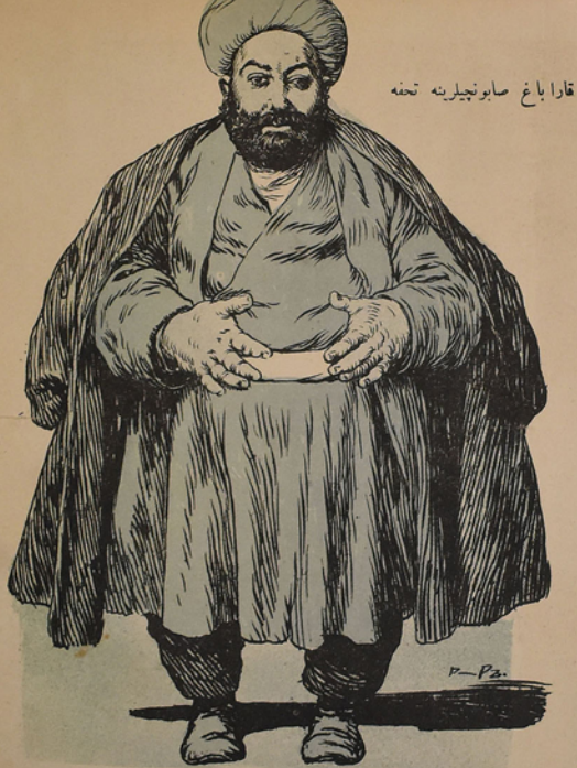
قارا باغ صابونچیلرینه تحفه

ضمینلشدیکجه ملت بو کر کلدی یدی ایچدی شیشوب بو حده گلدی