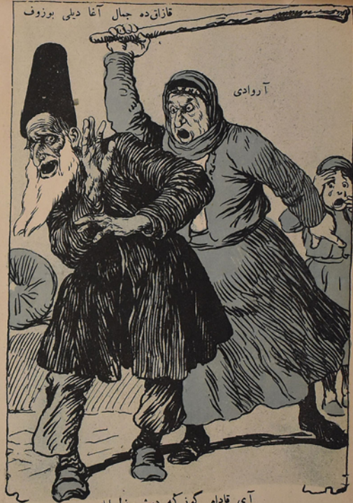
قازاقده جمال آغا دیلی بوزوف

ضمینلشدیکجه ملت بو کر کلدی یدی ایچدی شیشوب بو حده گلدی