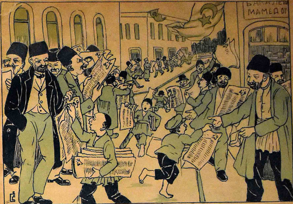
تورکتر یونانلاری ازهنده