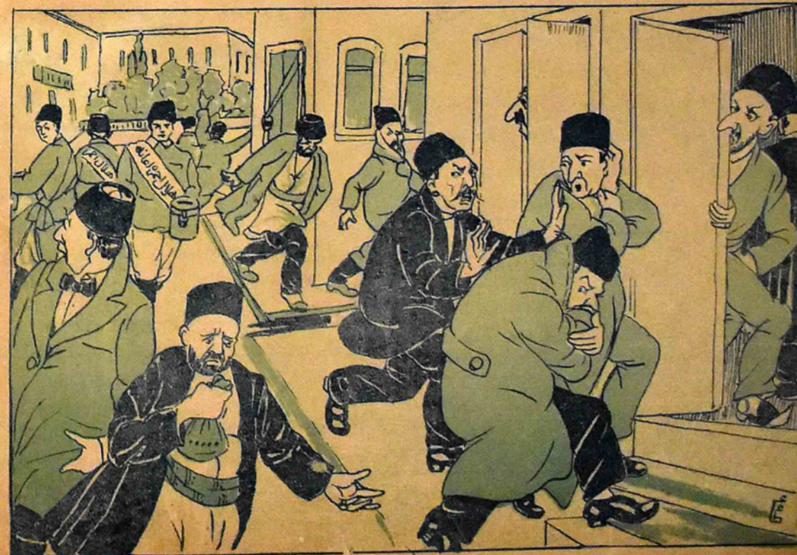
آناطولی حربدهارینه اعانه توپلایانده