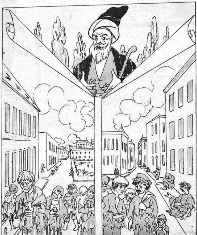
کوچه اوشاقلارینه یاردیم هفتقه سنلک سوکره .

۲۰۹۰ قىتى ساتىجى اينده ۶ ميليون Molla - Nəsrəddin 6 мил.р. № 20