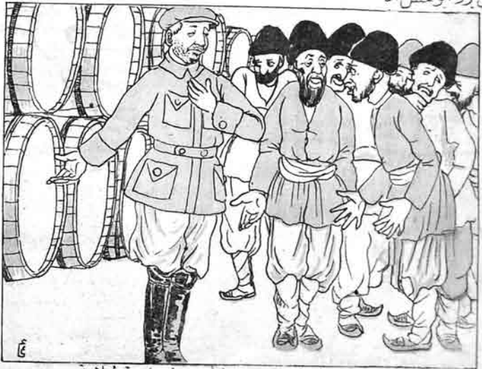
شاهزستانسوفی باندله (ساوغوز) اینجیلرینه نرمت حتی اولارق بوغدا ایوفی عرینه شراب میرلور. (باکیکی بابیجی. نمره ۶۴)