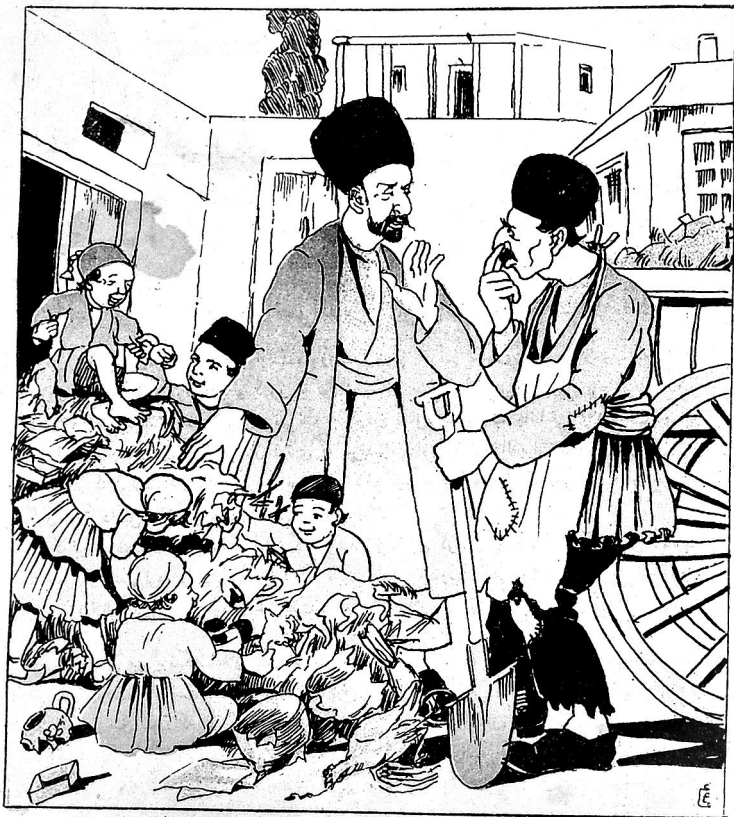
کربلائی - آی قارداش بو زیبیلر اوشاقلاریمز ایچون مشغولیتدر: