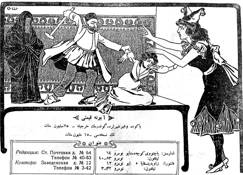
آبونه قیمتی با کوچه وغیرشهرلرده گوندنرک خرچله - ۷۵ میلیون منات تک نسخه سی - ۱۵ میلیون منات

اداره من: پانچوی کوجهده، ابو نومرو ۶۴ تلفون: ۴۰۸۳ فانتورا: زاویدیشایا * ابو نومرو ۱۲ تلفون: نومرو ۳۰۴۲ Redация: Ст. Почтовая д. № 64 Телефон № 40-83 Контора: Завельская д. № 12 Телефон № 3-42