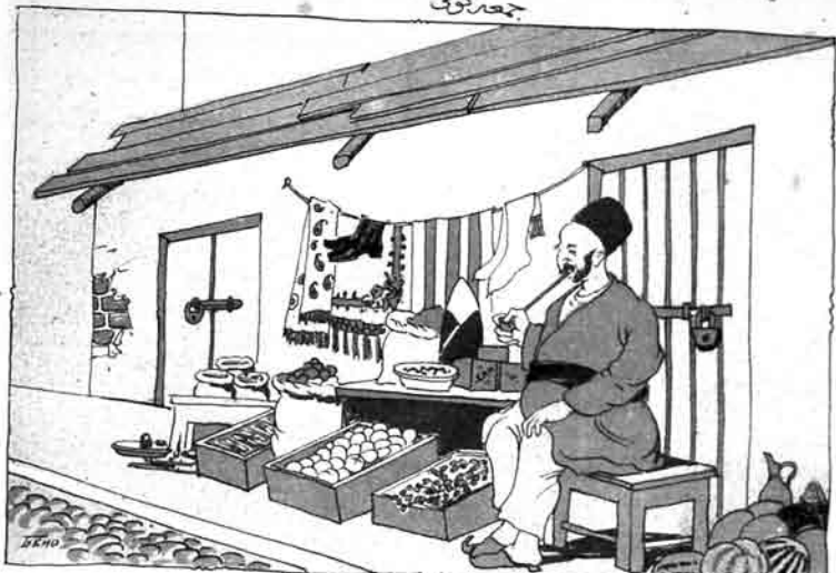
جمعہ گوی دکان آجماق قد غلدر اولک ایچوندہ من دکایمہ قفل وورہ یسام .