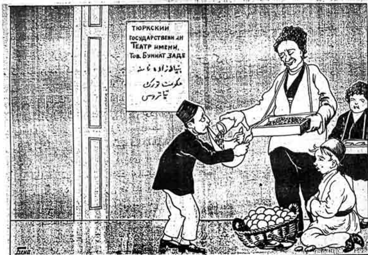
- تيز اول بر آد سه سيجما وير آچاروم لورژاده اوتوران تورك خاگرينه!