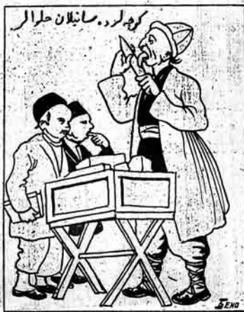
کجه لوده سانبلان حلالم