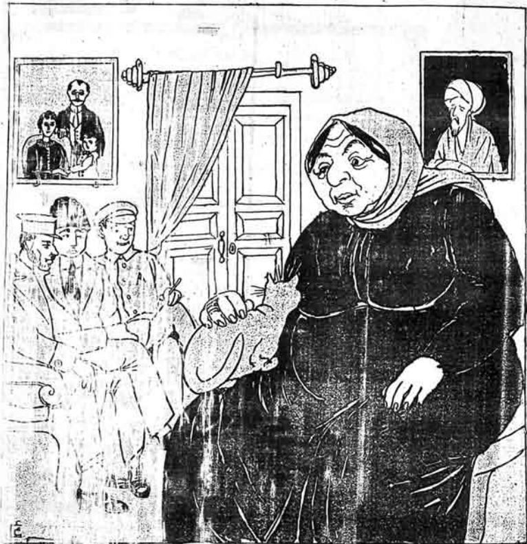
سینه قریبی نه سستورنه بیوره م نه فرسوموله بیوره م نه ده قولوقی بیوره م

№ 3 Цена 10 копеек. MOLLA - NƏSRƏDDIN ۱۰۰ لیرن ساتار ۳ قیتمی ساتیمی ایلده