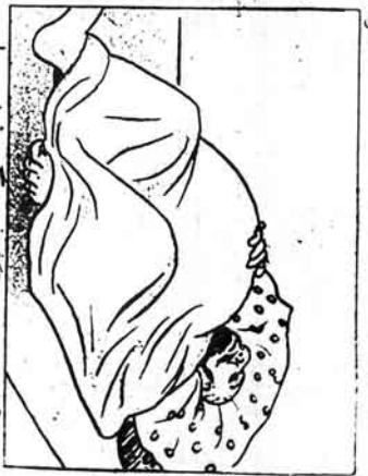
بيت افتخاسمندان يا تو! ايك بسيدم كه ميخريدان دورما يورم.