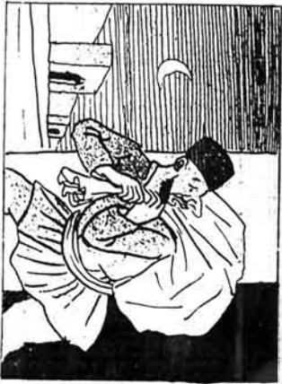
او در پيوق جا اقليرنك برشي.