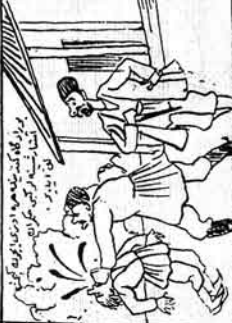
ایک نگران حیدرآبادی دیوانگاہ تدارک میں ایک شخص کو لے کر آ رہا ہے۔