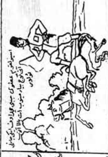
ایک نگران حیدرآبادی دیوانگاہ تدارک میں ایک شخص کو لے کر آ رہا ہے۔