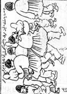
ایک نگران حیدرآبادی دیوانگاہ تدارک میں ایک شخص کو لے کر آ رہا ہے۔