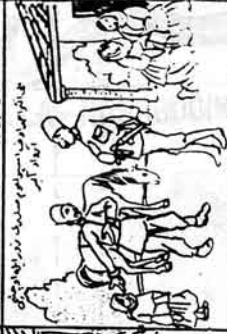
ایک نگران حیدرآبادی اسپتال میں سہولتوں کے لئے ایک شخص کو لے کر آ رہا ہے۔