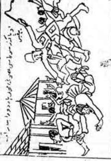
ایک نگران حیدرآبادی دیوانگاہ تدارک میں ایک شخص کو لے کر آ رہا ہے۔