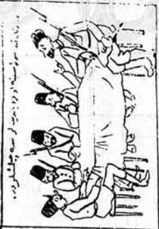
دیوانگاہ تدارک میں حیدرآبادی نگرانوں کی ایک مجلس.