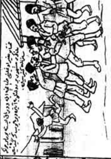
ایک نگران حیدرآبادی دیوانگاہ تدارک میں ایک شخص کو لے کر آ رہا ہے۔