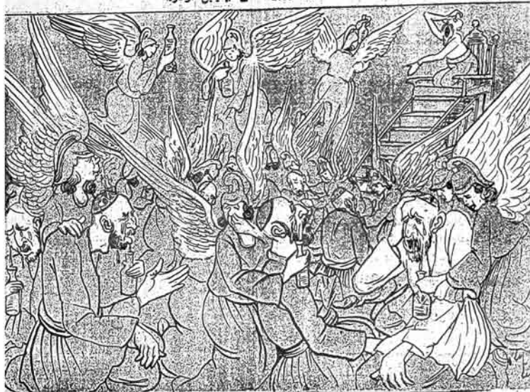
مالكەلەر جەنمەك بازارى ئوما ندىسىدەر. ھەزگە موملارنىڭ كوزى باشلارنى جەنمە ئوكوب. سوندرەمەلەر دىتەي دە ياندىر.