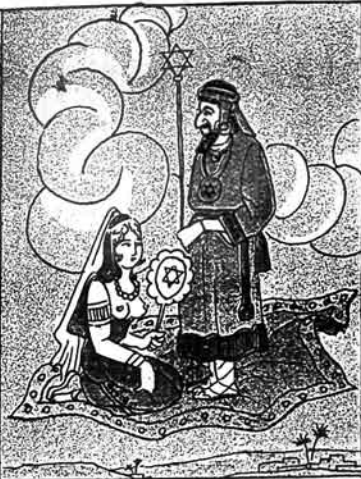
(۱) سلیمانک یونکہ مری (خالچہ)