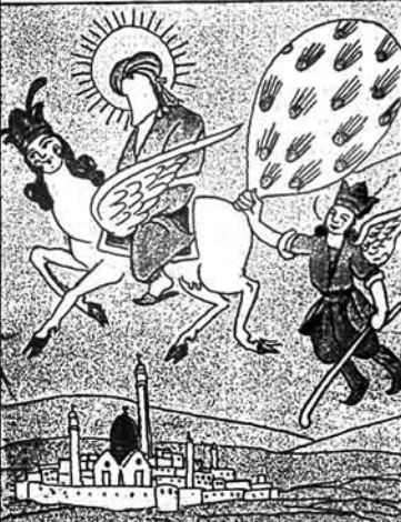
(۳) محمدک یونکہ مری (معراج گیمہ سی)