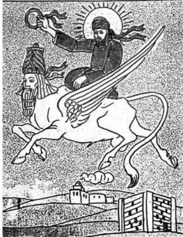
(۲) زردشتک یونکہ مری (اساطیر او کوئی)