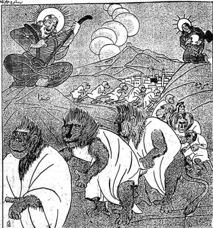
عرفات (اعمال تجدد بر نمونه)