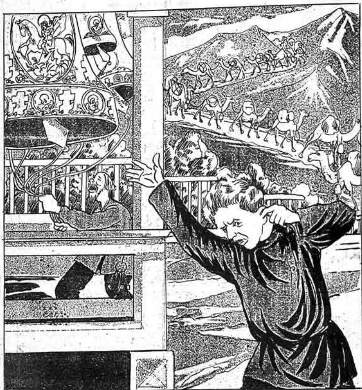
هله بوده و ملر حیواندر آکلامیوب داتا داتق سالیولار، بس، بو آداملاو نه داتق-داتق ایدیور؟!

№ 15 Цена 20 коп. MOLLA - NƏSRƏDDİN تیک ۱۵۹ قیمت ساتیجی ایلده ۲۰