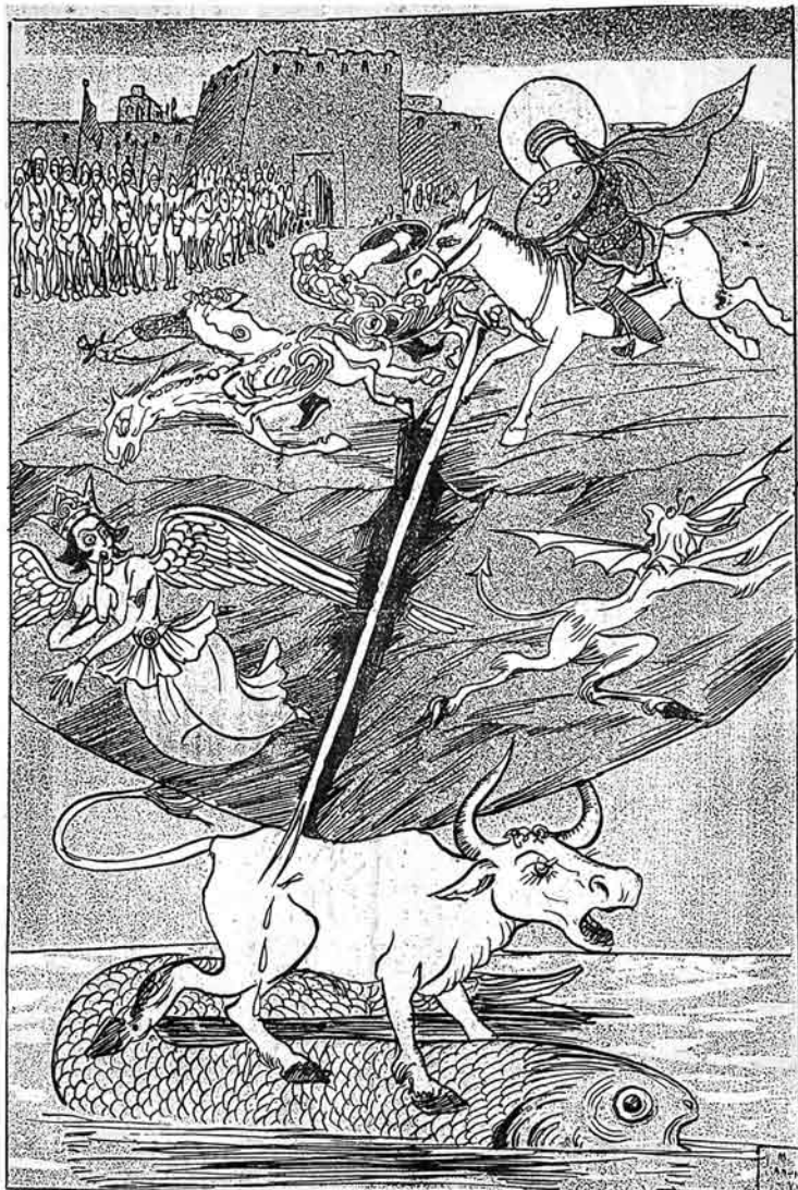
حضرت قلبی الہ ووردی کہ مرجی آتیله برا بر خیار کنی یاری بولوب جبرائیل کت قنادینی کسوب کدی یز او توری کت ده بیلینی یارالادی (تحفة المجالس)