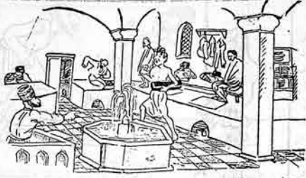
حمامچی - آی ارداش او پورتغیلی بیس هارا آبار برسن؟ مشتری - بولک ایچینده دیکته کیریم ایله قوبله قلیتمه مدر.

باشدان سالیاندا آخوند ملاساحیل توز مریدلریه جمعا ۶ نفر، لنگراندای اردییلی ملاحسن و طرفدارلاری عامو لیجا ۹ نفر، تیززده «آفای انگسی» و «مجتهد میرزامانق» توز مقدرلریه جملتان ۲۴ باش، پاکودا (شیخ شی)