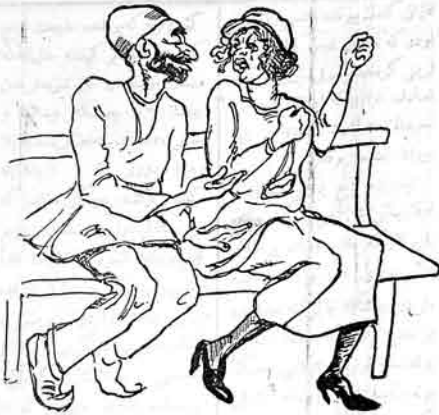
شهيدنك اظهار محبتى