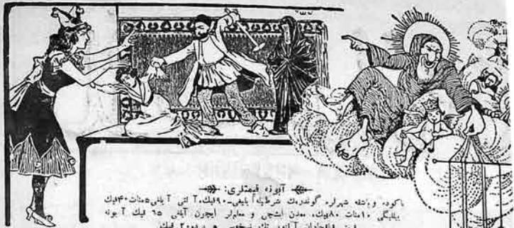
آبوزه قیصرلی: ۴۰۰ کورد، واته خیرله گوردنه شرطه آبیله-۹۰، ۹۱، ۹۲ ت ائی آبی عذاب ۴۰۰ یبلگی ۱۰۸۰، مدن اشج و مبار اجورن آبی ۶۵ لیک آبونه یئنی فاجدان آنورنک نسخسه هر روزه ۲ لیک عنوان: اداره و فاکتورامنتاری بوچوری او نومرو ۶۴ نیون، نومرو ۴۰۳-۴ Адрес Редакции и конторы: Старо-почтовая д. № 64. тел. № 40-83.