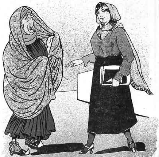
ماهیری — آی نیر تیلی! میچ اوتانیرسان یوزنگی آچیرسان! من باخ شه گور نېچه چارشاف سالیرام تیلیلی — بو صفت منده اولسا ابدی چارشاف سالدا، دگل بایرا جیچمالردیم.