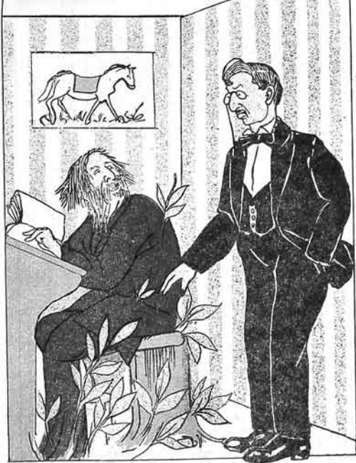
معلم — دی گوروم نېچه ایل سفایانی اشغال ایدمچکن. طلبه — عهلهک توزسک و سفایامک یره کوک آتیش بایرالاریندان جیچک آجاندا.